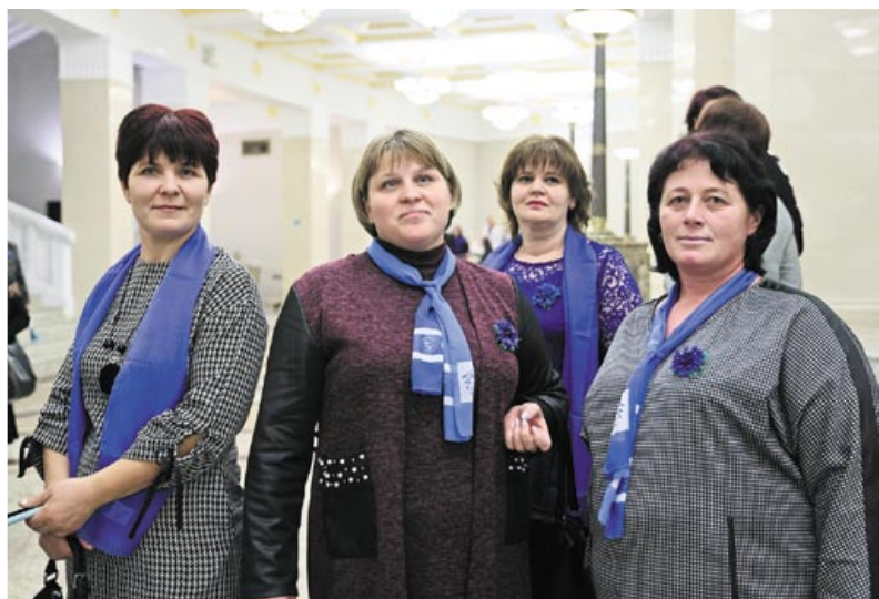
Участницы II Форума тружениц села в Большом театре Беларуси

– Для меня здесь нет ничего такого, о чем можно было бы спорить. Убеждена, что современная