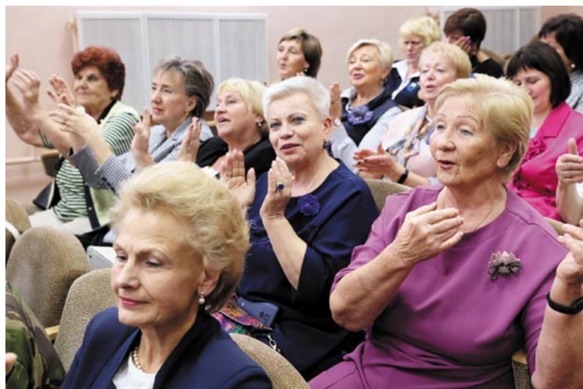
На республиканской встрече-чествовании известных женщин Беларуси в Заславле 27 сентября 2023 года

Поверьте, это волнующее и непередаваемое ощущение, когда люди понимают, что таких, как они, любящих родную страну, реальных патриотов, равнодушных к происходящему, способных помогать друг другу, очень много. Согласитесь вы или нет, но мне кажется, что в женском сообществе это особенно важно.