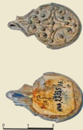
Рисунок 7. Подвеска с орнаментом в виде волот, Заславль

На территории Беларуси зарегистрировано немало кладов, относящихся ко второму периоду обращения дирхама в Восточной Европе (833–900 годы). Компактные группы этих кладов выявлены в окрестностях Полоцка, Витебска и Минска. Эпизодически они встречаются и на окраинах Полоцкой земли (Ахремцы – 852/853 годы; Поречье – 851/852; Баево – 862/863; Добрино – 841/842; Симоны – 845/846; Брили – 890/891). Для этого времени констатируется тенденция совпадения ареала куфического серебра и синхронных