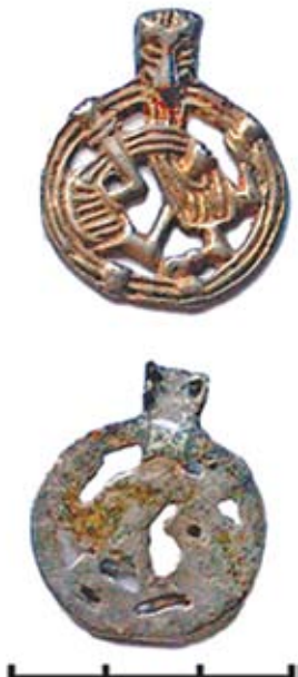
Рисунок 6. Подвеска в стиле Борре, Избище

Как образец скандинавского ювелирного ремесла можно рассматривать серебряную литую прорезную подвеску, обнаруженную при раскопках курганного могильника у д. Избище в окрестностях Минска [24, с. 81, 84, рис. 2]. Центральную часть артефакта занимает образ зооморфного существа, выполненного в скандинавском стиле Борре (рис. 6). В Беларуси известно два подобных экземпляра с городища Муравельник [25, с. 43], а также отдельный фрагмент с селища Моисеевичи [26, с. 122–123].