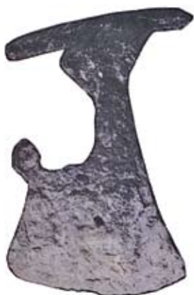
Рисунок 2. Топор, д. Дудовка

Бронзовая равноплечная фибула, найденная на городище у деревни Масковичи в Браславском Поозерье, датируется IX веком (рис. 3). Предполагается, что артефакты подобной формы и орнаментации возникли в Северной Европе как результат культурного влияния Франкской империи на раннем этапе эпохи викингов. Они использовались для скрепления верхней одежды скандинавской женщины в ранний период истории викингов, а в некоторых регионах Скандинавии и Древней Руси – в средний период, когда их место занимают трехлистные и большие круглые фибулы. Застежка с городища Масковичи имеет близкие параллели в североевропейских