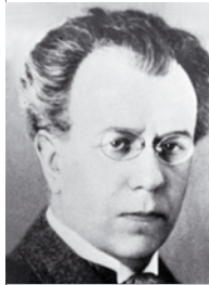
В.И. Пичета. 1920-е годы

Трэба адзначыць, што для развіцця дзяржаўнага палітэхнікуму, які пры гэтым быў размеркаваны вельмі шырока, бо сярод факультэтаў яго быў не толькі аграрнамічны і меліярацыйны, але і факультэт тэхнічна-будаўнічы, не было ніякае глебы. Зразумела, на Беларусі адчувалася патрэба ў аграрнамічным і меліярацыйным факультэтах, але факультэты тэхнічна-прамысловага характару, пры адсутнасці буйнае прамысловасці на Беларусі, былі, безумоўна, непатрэбнымі.