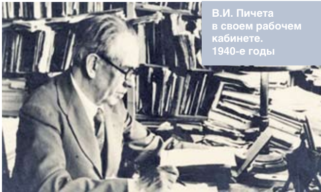
В.И. Пичета в своем рабочем кабинете. 1940-е годы

своим лекциям и занятиям как в высшей, так и в средней школе, что не нравилось моим учителям. Я пошел против представителей буржуазной науки, не боялся критиковать Ключевского, но рядом с Богословским, Готье, Яковлевым мои критические замечания могли оказать влияние только на весьма небольшую группу моих учениц, занятия с которыми мне доставляли большое моральное удовлетворение. На почве марксизма я идеологически разошелся с отдельными представителями буржуазной исторической науки. Я начал читать курс по истории Украины и выдвигал идею автономии и права на культурно-национальное самоопределение. Я одновременно продолжал один заниматься наукой и готовиться к магистранскому экзамену, имея 36 уроков в неделю, и, работая без перерыва в течение трех лет, не имея никаких каникул, я, казалось, добился своего. Я, не оставленный при Университете, стал приват-доцентом. Но я был им только два месяца /октябрь – декабрь 1910 г./ Я не мог оставаться в Университете и работать под полицейским надзором, и я оставил Университет, куда меня вернула только Октябрьская революция. Мои учителя были довольны моим уходом. Я был для них вредным и опасным