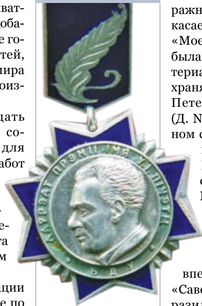
Нагрудный знак «Лауреат премии имени В.И. Пичеты»

Восприятие и оценка публикуемых текстов за читателем.