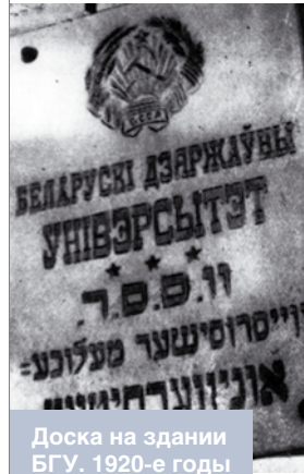
Доска на зданні БГУ. 1920-е годы

Наркамасветы У.М. Ігнатоўскі, адкрываючы ўрачыстае пасяджэнне, абвясціў дэкрэт урада аб адчыненні на Беларусі ўніверсітэта, а таксама і пастанову Калегіі Наркамасветы аб прызначэнні рэктарам універсітэта У.І. Пічэта, сябрамі праўлення У.М. Ігнатоўскага, Ф.Ф. Турука, М.Я. Фрумкінай і прадстаўніка ад студэнтаў. На ўрачыстым пасяджэнні было сказана шмат прамоў, якія як бы намячалі ідэалагічную праграму будучае чыннасці дзяржаўнага ўніверсітэта.