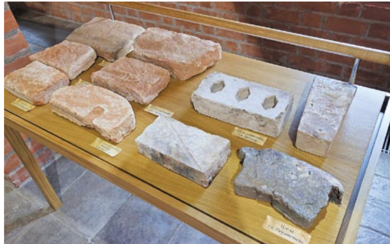
Самые известные в Лидском районе кирпичные заводы находились в деревнях Перепечицы, Шейбаки и Хоружевцы

менты, а также «тяжеловесы» около девяти килограммов. Именно из таких, более долговечных и надежных, строили когда-то крепости. Одной рукой такого великана и не поднять.