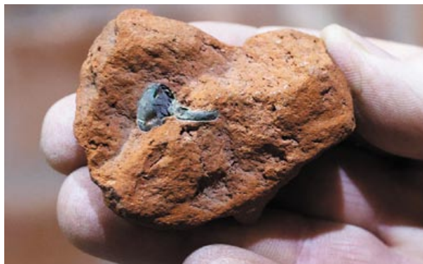
Кирпич с пуговицей: случайность или послание потомкам?

собачьей и куриной лап, детской пятки и другими «отметинами».