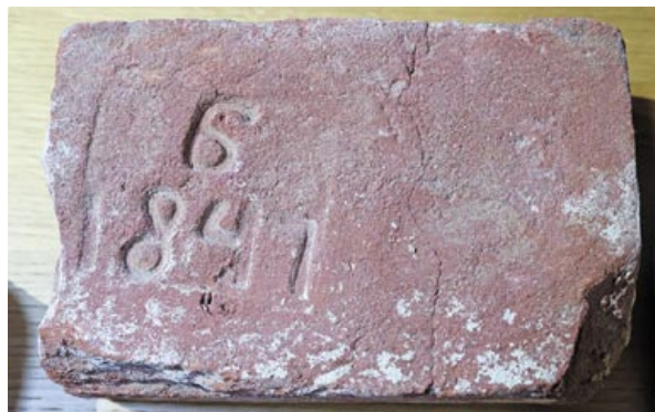
По цифрам на кирпиче можно узнать имя мастера и год выпуска