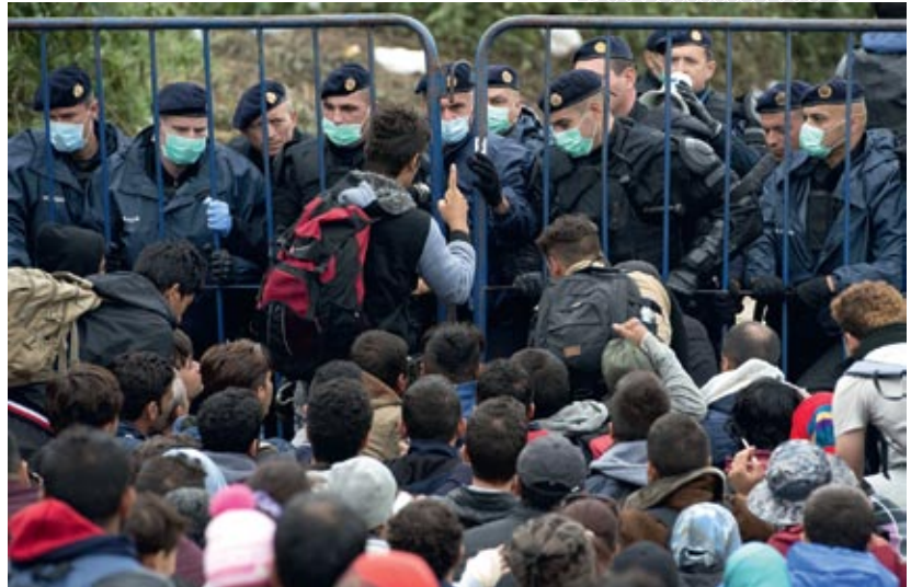
▲ Беженцы на сербско-хорватской границе. 2015 год

На фоне экономического подъема и повышения уровня жизни в Европе получили дальнейшее развитие идеи панъевропеизма и мультикультурализма. Они как нельзя лучше объясняли европейскому обывателю сущность происходящих изменений и поэтапное размывание национальных устоев. На той волне переселения миграционные процессы носили позитивный характер, позволяя восполнять «кадровый голод» экономики в низкооплачиваемой сфере, обусловленный уменьшением рождаемости, эмиграцией и ростом средней продолжительности жизни коренного населения. Период на рубеже тысячелетий явился поистине «золотым» для Европы. На фоне государств постсоветского пространства, Африки, Ближнего Востока