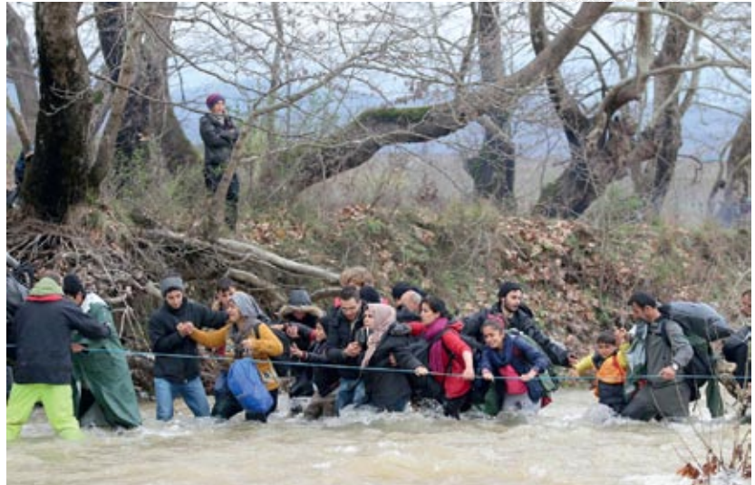
▲ Беженцы пытаются переправиться через реку на границе Греции и Македонии. 2016 год

Однако рассматривать сегодняшнюю европейскую миграцию исключительно как следствие демографии крайне неверно. В настоящее время происходит передел