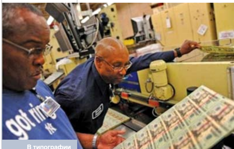
В типографии Бюро по выпуску денежных знаков и ценных бумаг казначейства США

В связи с отсутствием должного контроля над производством бумажных денег, не обеспеченных содержанием чистого золота, в соответствии с производством валового внутреннего продукта, стоимость бумажных денег в последнее время многократно превышает стоимость производимого ВВП во многих странах мира.