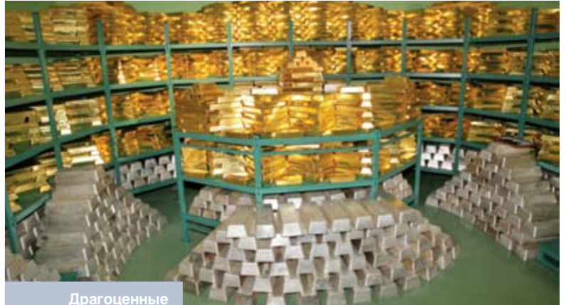
Драгоценные металлы в слитках в Центральном хранилище Национального банка Республики Беларусь

В отдельных государствах большая сумма денег производится для удовлетворения потребностей заемщиков в кредитах. А также «штампуются» большое количество ценных бумаг, которые экономически недостаточно обоснованы. Кроме того, их изготовление осуществляют не только определенные государственные банки, но и другие учреждения страны. Во многих странах мира большая сумма виртуальных денег производится банками в результате занижения процентных ставок кредиторам и повышения – заемщикам денег. Все это содействует увеличению объема производства денежной массы по отношению к росту ВВП страны, что является одной из главных причин обесценивания денег. В сложившихся условиях, когда наряду с ростом производства продукции повышаются цены на товары и увеличивается количество бумажных денег, общей тенденцией стало то, что значительно меньше уделяется внимания цене денег, то есть затратам труда, времени и материальных средств на производство единицы продукции, объема выполненных работ и оказанных платных услуг, а тем более содержанию чистого золота в денежных единицах. В настоящее время очень трудно понять, кто, где и на основании каких конкретных экономических данных устанавливает курс денежных