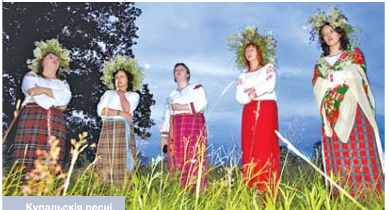
Купальскія песні. Вёска Дубнякі Полацкага раёна

Купальская абрадавая ўрачыстасць вядомая амаль што ўсім славянскім і балцкім народам. Лічыцца, што самы шчаслівы будзе той, хто здолее сарваць кветку папараці: ён адразу ж атрымае чудадзейную здольнасць бачыць у глыбіні зямлі закапаныя скарбы і столькі можа мець срэбра-золата ды ўсялякіх іншых каштоўнасцей, колькі яму самому пажадаецца. Шукаць можна да ўзыходу сонца (у народным усведамленні «ад другіх да трэціх пеўняў»), калі першыя сонечныя промні не зліюцца ў адзінае з галасістымі крыкамі пеўняў. Распавядалі і пра тое, што быццам бы бачылі саму папараць-кветку, ды толькі сава, філін ці ведзьма перашкодзілі дастаць яе.