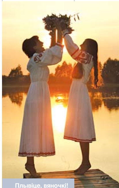
Пльвіце, вяночкі! Свята Купалле ў Брэсцкім раёне

Колькі існуе чалавецтва, столькі яно спрабуе зазірнуць у будучыню. Купаль-