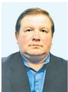
Аляксей НЕНАДАВЕЦ , доктар філалагічных навуک, прафесар