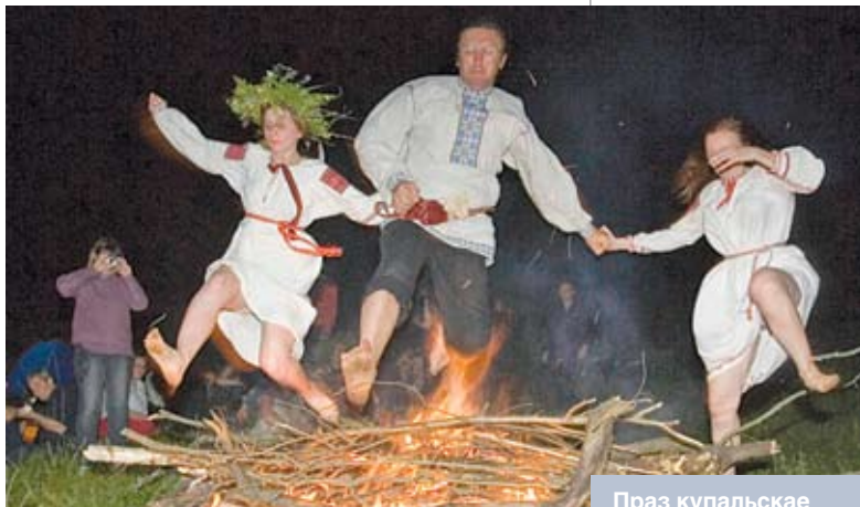
Праз купальскае вогнішча. Орша

Шырокаўжывальнымі былі абрады і вераванні, якія звязваліся з гаспадарчай, земляробчай дзейнасцю чалавека. Адзначалася, што менавіта ў гэтую ноч ведзьмары могуць рабіць заломы ў збожжы. Таму пасля заканчэння свята хлопцы і дзяўчаты стараліся параскідаць патушанья галавешкі па палетках, каб такім чынам засцерагчы збажыну ад непажаданага на яе ўздзеяння.