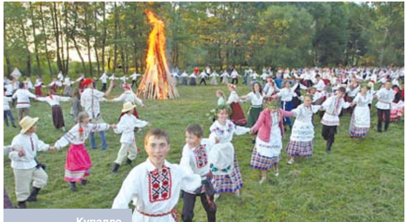
Купалле ў Гомельскім раёне

Да Купалля рыхтаваліся зранку. Асноўная нагрузка і адказнасць ускладвалася на дзяўчат і маладых жанчын. Першыя адпраўляліся на луг і там рвалі кветкі на святочныя вянкi. Яны ж збіралі таямнічыя расліны – зёлкі, што нібыта ўплывалі на ўзаемаадносіны паміж хлопцамі і дзяўчатамі, і таму ім прыпісваліся чароўныя ўласцівасці. Калі дзяўчаты разлічвалі толькі на прычараванне хлопцаў, на іхняе каханне, то замужнія жанчыны збіралі травы і карэнне, якія потым на працягу года служылі ў сям’і для вылечвання ад усемагчымых хвароб і пошасцей, а таксама (што немалаважна!) засцерагалі ад уплыву на людзей, як лічылі самі сялянкі, розных звышнатуральных істот (чарцей-нячысцікаў). З вядомых нам зёлак, якія збіралі ў гэты дзень, можна назваць купалку, багаткі, папараць, васількі, руту, браткі і некаторыя іншыя. Лекавыя травы, што называюць у народзе «святаянскімі зёлкамі», выкарыстоўваліся пры лячэнні розных хвароб і правядзенні ачышчальных рытуалаў; у сям’і, дзе быў хворы, утырквалі на стыку бярэнаў хаты кветкі купалкі: калі на наступны дзень кветкі бачылі звылымі, лічылі, што вельмі хутка ён пойдзе на той свет; закідвалі на стрэхі хат, дзе жыла дашлюбная моладзь, вянкi з купальскіх кве-