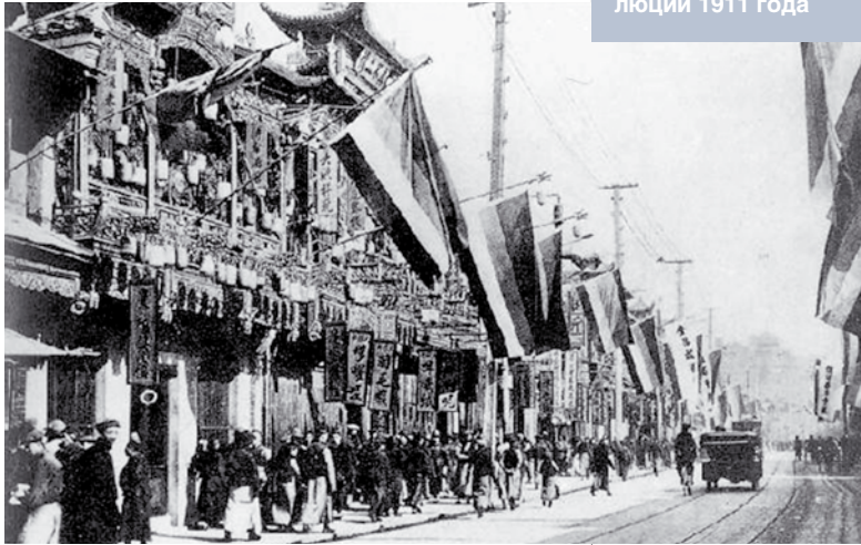
Главная улица Шанхая во время Синьхайской рево- люции 1911 года

конец 1912 – начало 1913 года выборами в постоянный парламент. Юань Шикай проигнорировал созванный в апреле 1913 года парламент и начал готовиться к борьбе с Гоминьданом посредством военного похода верных ему войск на революционный республиканский Юг Китая. В ноябре 1913 года диктатор распустил парламент, большинство которого составляли депутаты от Гоминьдана. В марте 1914 года Юань Шикай открыто выступил против суньятсеновской временной конституции, принятой в Нанкине в 1912 году, а 1 мая опубликовал новую, согласно которой президенту предоставлялись почти неограниченные