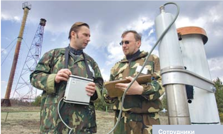
Сотрудники исследовательской станции «Масань» (Хойникский район) проводят мониторинг радиационной обстановки

на цели отселения. Концентрации ресурсов на решении первоочередных задач способствовало и создание научных учреждений, которые занимались изучением влияния радиации на состояние здоровья человека, на природную среду. В частности, благодаря комплексу практических и научных действий удалось обеспечить производство и реализацию продуктов питания, удовлетворяющих нормативным требованиям. Это очень важный и нужный раздел, проходящий через все чернобыльские программы, которые принимались у нас в стране, – а их после первой было реализовано еще три. Кроме защитных мер в сельском и лесном хозяйстве, большую роль в этом сыграло создание службы радиационного контроля и соответствующей нормативной базы. И постепенно признаки радиофобии, которые начали было появляться у части наших сограждан, сошли на нет – для опасений и недоверия просто не осталось почвы.