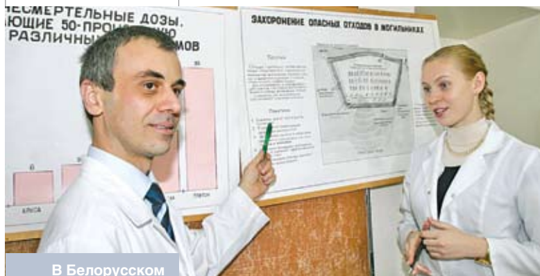
В Белорусском государственном медицинском университете готовят специалистов для работы на белорусской АЭС