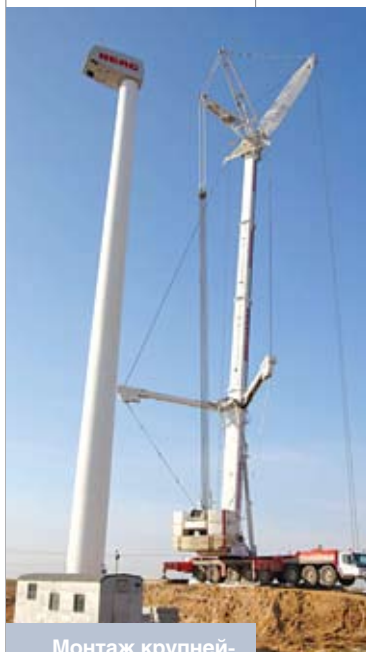
Монтаж крупнейшей в Беларуси ветроустановки мощностью 1,5 МВт. Новогрудский район, март 2011 года

Н.М. Груша: Все возобновляемые источники грешат одним: они являются малоконцентрированными и характеризуются непостоянством, то есть сильно зависят от времени суток, от сезона. Я уже не говорю про их технический потенциал. К примеру, все, что способна когда-либо дать в стране гидроэнергетика, составляет 800 МВт,