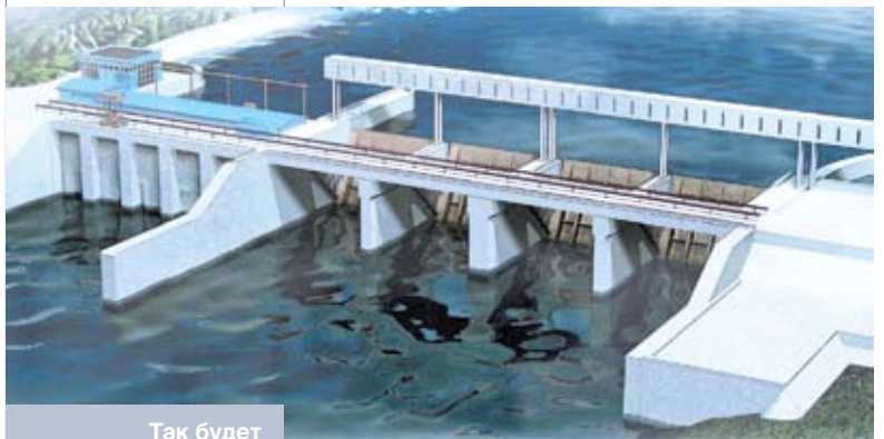
Так будет выглядеть строящаяся ныне Гродненская ГЭС

В контексте сказанного строительство атомной электростанции, в результате которого из 21–22 млрд. куб. м природного газа, потребляемого сегодня Беларусью, будет замещено 5 млрд. куб. м, представляет собой весомый посыл в плане диверсификации существующего топливно-энергетического баланса. Реализация данного проекта сулит значительное повышение уровня энергобезопасности страны, а также позволит сдерживать рост тарифов в условиях продолжающегося в мире увеличения цен на газ и нефтепродукты. Средняя себестоимость производства электроэнергии на российских атомных электростанциях составляет несколько центов за 1 кВт•ч, в то время