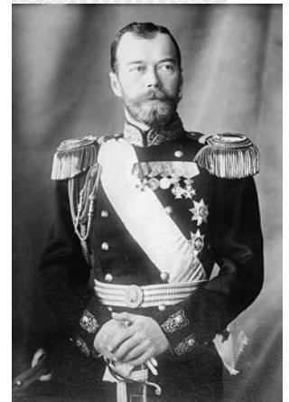
Российский император Николай II

Таким образом, религиозная политика в Российской империи в начале XX века характеризовалась инертностью и нежеланием правительства предоставлять своим подданным свободу вероисповедания, которой население западных стран к тому времени пользовалось уже более столетия. Только революционная ситуация 1905 года вынудила царское правительство пойти на определенные уступки в этом вопросе. Религиозная политика Российской империи, которая зиждилась на принципе веротерпимости и чрезмерной опеке Православной церкви, имела своим следствием религиозную индифферентность определенной части населения. Она и стала благоприятной почвой для появления атеизма, который после 1917 года приобрел воинствующий характер и не терпел уже никакой религии. ┘