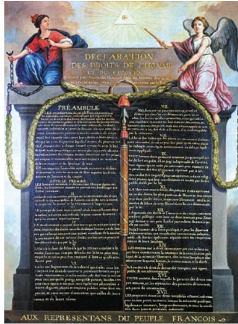
◀ Декларация прав человека и гражданина 1789 года

Таким образом, законодательство Российской империи начала XX века в значительной степени ограничивало право на свободу вероисповедания. Вопрос о