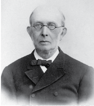
Обер-прокурор Святейшего синода К.П. Победоносцев