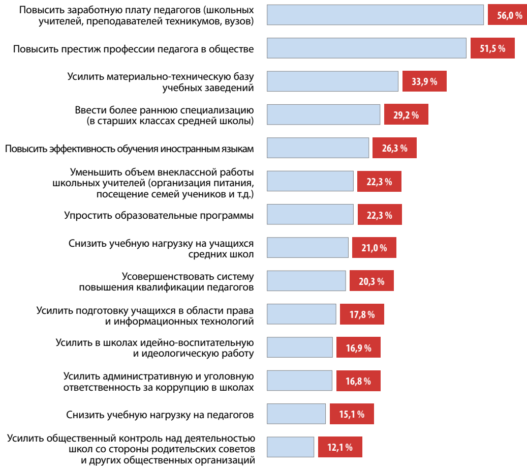
◀ Рисунок 4. Пути повышения качества и конкурентоспособности отечественного образования

во втором чтении эта статья была снята, и все вернулось «на круги своя».