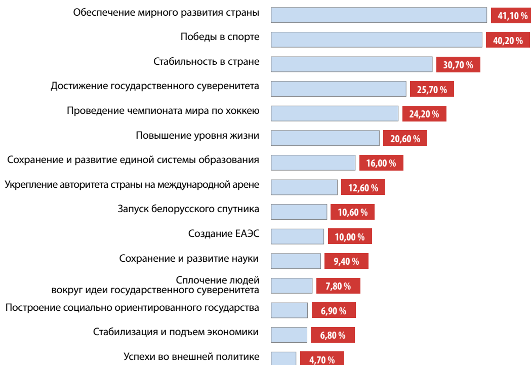
◀ Рисунок 2. События в стране, вызывающие чувство гордости у населения

(рис. 2). Только 6,8 % опрошенных полагают, что особых поводов для гордости за страну нет.