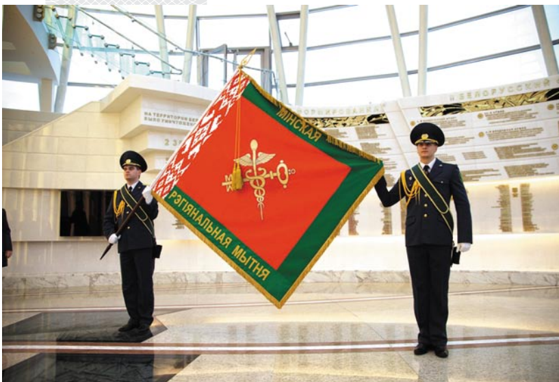
▼ Знамя Минской региональной таможни