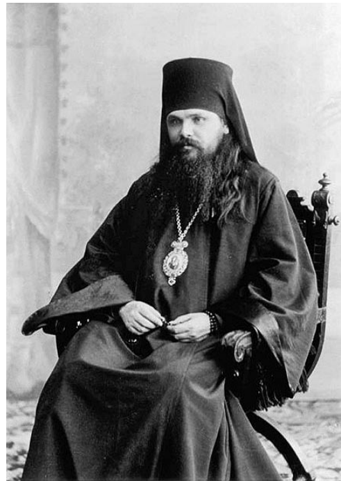
◀ Епіскап Мітрафан

Забаранялася прадаваць моцныя спіртныя напоі ў час царкоўных хрысціянскіх свят, урачыстасцей, звязаных з імператарскай сям'ёй (дні нараджэння імператара, імператрыцы і спадкаемца трона, гадавіна каранавання), а таксама ў дні кірмашоў, мясцовых сходаў, разгляду судовых спраў у валасных судах, у час прызыву навабранцаў і запасных [4, с. 138]. Продаж моцных напояў забараняўся таксама ва ўсіх дзяржаўных установах, у грамадскіх месцах і месцах народных гулянняў (тэатры, кінематограф, канцэрты, гарадскія сады і іншыя). У звычайныя дні продаж дазваляўся з 9 да 23 гадзін у гарадах і да 18 гадзін у сельскай мясцовасці.