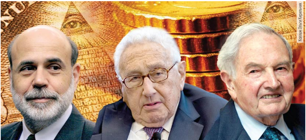
Коллаж Ольга Кирильчук

По мнению БК как инициатора и организатора цветных революций в мире, любые кризисы подталкивают