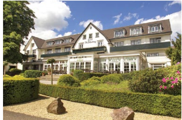
Первое заседание Бильдербергского клуба состоялось в 1954 году в отеле голландского Оостербека

По общему мнению исследователей концепции нового мирового порядка, идея которого последовательно проводится БК, ее воплощение приведет к