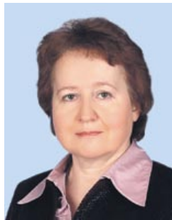
Людмила СЕМЁНОВА, доктор исторических наук, профессор

Людмила СЕМЁНОВА. Властная вертикаль vs олигархическая демократия. Олигархия как сообщество богатых людей, владеющих важнейшими ресурсами общества, оказывает большое влияние на государственную власть и играет значительную роль в управлении. Олигархия традиционных и феодальных обществ правила открыто. Власть капиталистической олигархии опосредована институтами демократии. Возвращение постсоветских республик в периферию мировой капиталистической системы привело к формированию олигархии. Особняком стоит белорусская социально-экономическая модель, не допускающая олигархизации власти.