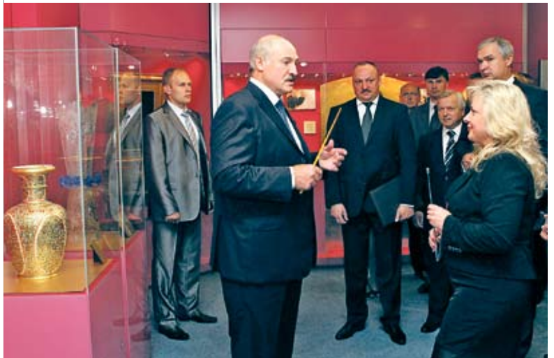
Аляксандр Лукашэнка ў час наведвання Музея сучаснай беларускай дзяржаўнасці. Чэрвень 2012 года

асобныя часткі распрацоўваў В. Рысакоў, аўтар мастацкага вырашэння экспазіцыі – У. Кандрацьеў. Усе гэтыя людзі – асобы ў нашай справе вядомыя і аўтарытэтныя, яны ўдзельнічалі ў стварэнні не адной музейнай экспазіцыі. Сур'ёзную падтрымку ў час работы над экспазіцыяй аказваў кіраўнік Адміністрацыі Прэзідэнта У. Макей. Вядома ж, шмат давялося папрацаваць невялікаму калектыву нованароджанага музея: акрамя загадчыка, гэта 4 маладыя навуковыя супрацоўнікі: сёння яны і фандавікі, і экспазіцыянеры, і экскурсаводы ў адной