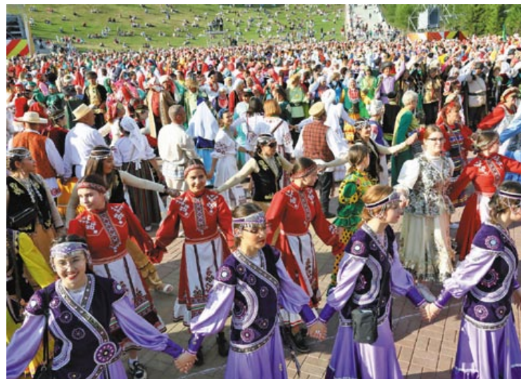
Рекордный «Хоровод дружбы» объединил в единое целое почти три тысячи человек

Как достигнуть большего? Ответ очевиден: повышая конкурентоспособность наших стран. Для этого необходимо углублять промышленную кооперацию, решать вопросы специализации, импор-