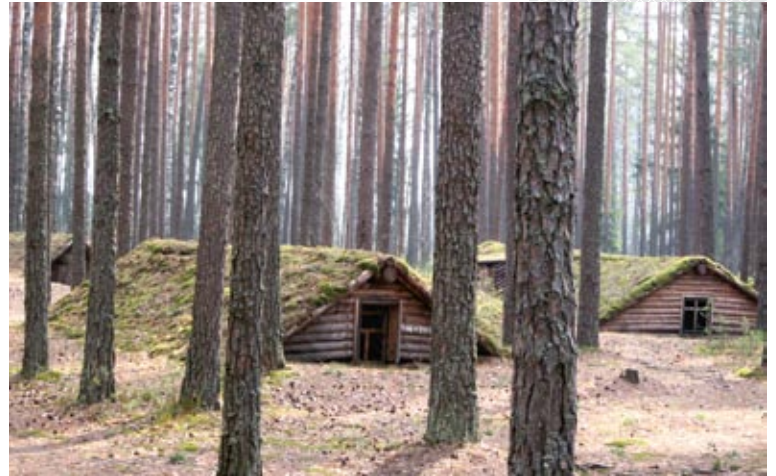
◀ «Партизанский лагерь» – часть мемориального комплекса «Усакино»: хлебопечкарня и землянки

Не всегда, правда, полеты завершались благополучно. Так, 30 мая 1944 года с эки-