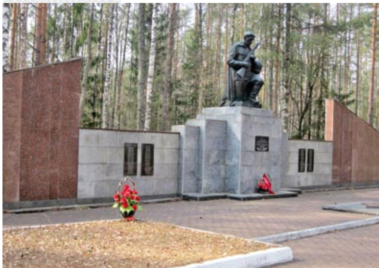
▲ «Стена Памяти» на братском кладбище мемориального комплекса «Усакино»

Естественно, что вместе с помощью в налаживании жизнедеятельности гражданского населения Кличевской партизанской зоны отряды народных мстителей проводили и военные операции по уничтожению врага. Об их успехах можно судить по таким, например, фактам. Только в феврале 1943 года они подорвали 27 эшелонов противника, разгромили четыре фашистских гарнизона, 10 полицейских участков, семь волостных управ. В апреле того же года уничтожили восемь гарнизонов, 6 октября – сильно укрепленный гарнизон в деревне Козуличи Кировского района и несколько подразделений карателей, 9 апреля 1944 года – гарнизон в местечке Погост Березинского района.