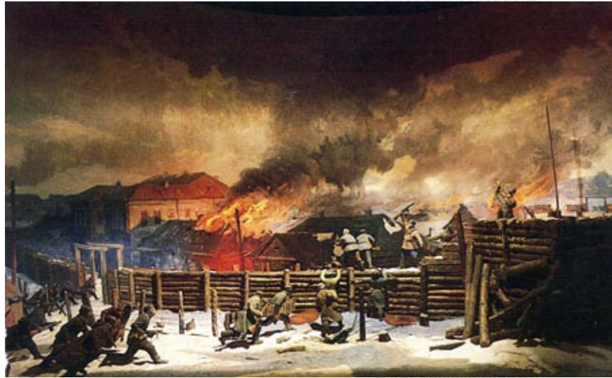
▲ Диорама «Бой за Кличев 20 марта 1942 года» в экспозиции Кличевского краеведческого музея