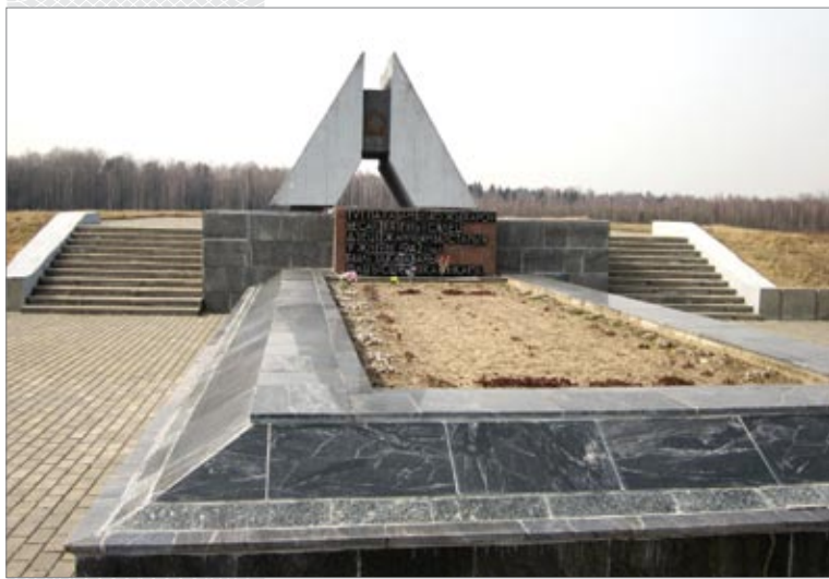
▼ Мемориал «Расколотая хата» – братская могила расстрелянных фашистами 140 жителей деревень Вязень и Селец

А вот сведения из отчета командования 277-го отряда, перегруппированного позднее в полк: за время существования этим партизанским формированием было проведено 117 крупных боевых операций, в результате которых пущено под откос более 50 эшелонов противника, разгромлено 45 гарнизонов и полицейских участков, уничтожено три танка, 127 автомашин, разрушено более 2 тыс. рельсов. И такие данные можно найти в деятельности каждого из партизанских отрядов Кличевской партизанской зоны.