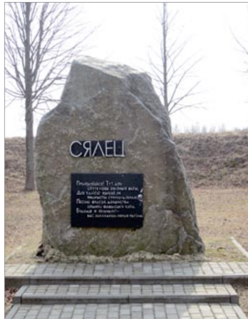
◀ Мемориальный знак на месте сожженной фашистами и не восстановленной после Великой Отечественной войны деревни Селец Кличевского района

Однако главная достопримечательность этих мест – созданный здесь еще в 1985 году методом народной стройки по проекту минского скульптора А. Калниньша мемориальный комплекс «Усакино». Находится он недалеко от одноименной деревни, являющейся в годы войны негласным центром Кличевской партизанской зоны. Мемориал объединяет четыре памятника: партизан-