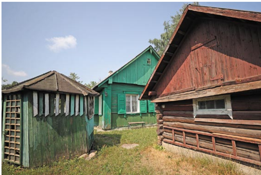
Дорогой сердцу Лученка родительский дом и беседка, где он любил принимать гостей. Марьина Горка. Июль 2023 года