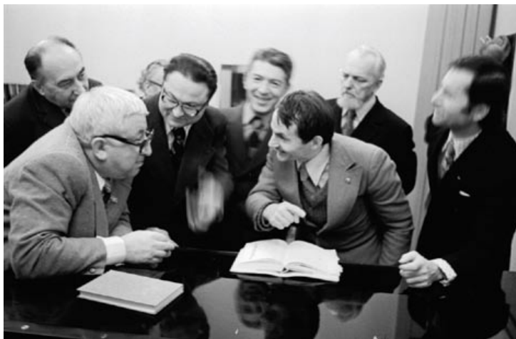
В 1977 году Игорь Лученко написал песню на стихи народного поэта Дагестана Расула Гамзатова «И в этом повинна жизнь одна». Момент творческой дискуссии