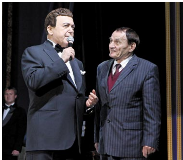
В Могилеве во время четырехчасового концерта народного артиста СССР Иосифа Кобзона прозвучало много песен Лученка. 23 октября 2012 года

мэтрам рок-н-ролла, так и не сделался маститым седовласым старцем. Что-то юношеское, благодаря этой комсомольской вере, сохранялось в его облике и повадках до самого конца.