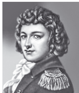
Михал Клеофас Огинский