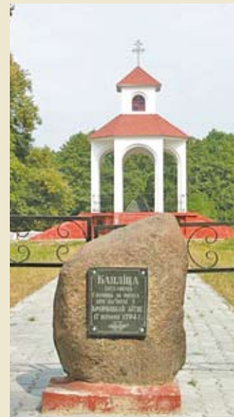
Часовня на месте Крупчицкой битвы (деревня Чижевщина Жабинковского района)

Однако и с набором рекрутов дело обстояло не лучшим образом. Различные слои общества проявляли индифферентность по отношению если не к идеям, то к участию в восстании. Документы того времени переполнены жалобами, угрозами различных повстанческих представителей, вызванных пассивностью жителей, их нежеланием сражаться против российских войск. В повстанческий центр в Вильно поступали реляции такого содержания: «Люд убегае из Вильно беспрерывно, так что кроме женщин (которые имеют панические