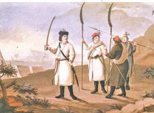
Косинеры в 1794 году. Акварель Михала Стаховича

После поражения в бою у д. Перебрановичи в мае 1794 года от российских войск «польские шляхтичи без особого сопротивления указали на место хранения оружия (пистолеты, пики, ружья) и заявили, что навеки останутся под покровительством России» [6, с. 161].