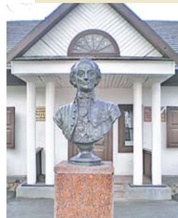
Кобринский военно-исторический музей имени А.В. Суворова