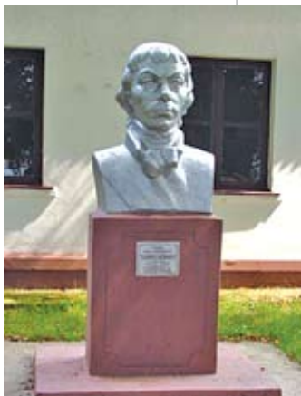
Памятник Т. Костюшко в д. Малые Сехновичи Жабинковского района

А вот польские повстанцы вовсе не были так миролюбивы. Фактически в 1794 году на территории, охваченной восстанием, был введен революционный террор. Уже в самом «Акте восстания народа Великого княжества Литовского» был прописан принцип, открывавший дорогу широкому применению насилия: «кто не с нами, тот наш враг» [1, с. 49]. Одной из первых жертв террора стал великий гетман ВКЛ Ш.М. Косаковский, сторонник разрыва унии с Польшей и заключения союза с Российской империей. Его повесили на Рыночной площади в Вильно. Во время совершения казни с показательной речью выступил Я. Ясинский: «Милостивые государи! Произойдет здесь дело, которое запрещается обсуждать, и будет ли оно нравиться кому из вас или нет, каждый обязан молчать, а кто голос свой подаст, будет неотложно на этой виселице повешен» [1, с. 59]. Я. Ясинский и в дальнейшем добивался широкого применения «репресса-