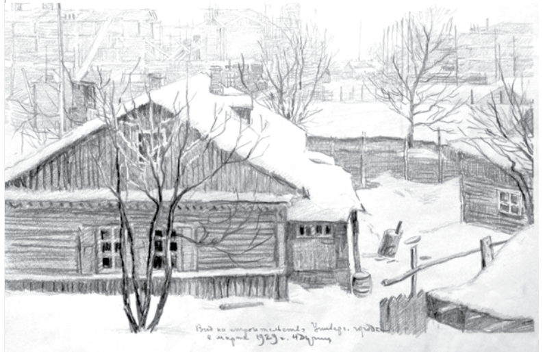
Вид на строительство Университетского городка. Рисунок художника Н.В. Дучица (1896–1980). Март 1929 года

свою репутацию как дотошного и профессионального законника. Поэтому «суровая критика» М.О. Гредингером на страницах «Советского строительства» проекта кодекса явно зацепила «за живое» и разработчиков, и самого наркома. Для «достойного» ответа автор избрал интеллигентно-издевательскую, а порой даже глумливую манеру предъявления своих претензий к замечаниям и их безоговорочного отторжения.