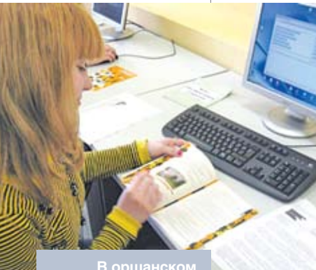
В оршанском городском Центре информационных технологий, оборудованном при поддержке Парка высоких технологий

Это прекрасно понимают в отраслевых концернах, в соответствии с указаниями которых практически на каждом предприятии создан свой интернет-сайт с англоязычной версией. Но, по мнению Дениса Кораблева, у маркетинговой политики большин-