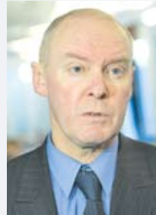
Андрей ТУР, заместитель министра экономики Республики Беларусь:

– Предпринимательство, будучи одним из реальных факторов социально-экономического развития любого государства, имеет вполне конкретные значения и определенные границы этих значений. Первый аспект заключается в том, что его представляют люди, обладающие значительной инициативой, которую они стремятся реализовать во всех отношениях: техническом, экономическом и социальном. Именно в данном блоке и завязан основной интерес и государства, и предпринимательства. Для первого он состоит в обеспечении занятости, выплаты зарплат, роста доходов населения. Нельзя забывать и о моментах, связанных с производством продукции. Поскольку его осуществляет инициативная часть общества, скорее всего речь пойдет о выпуске новой продукции, обладающей повышенной конкурентоспособностью и принципиально иными качественными характеристиками. Понятно, что в силу этого она обеспечивает достаточный уровень дохода, прибыли. С точки зрения возможностей их можно потратить как на потребление, так и на будущее развитие, совершенствование производства тех же выпускаемых товаров, услуг и так далее.