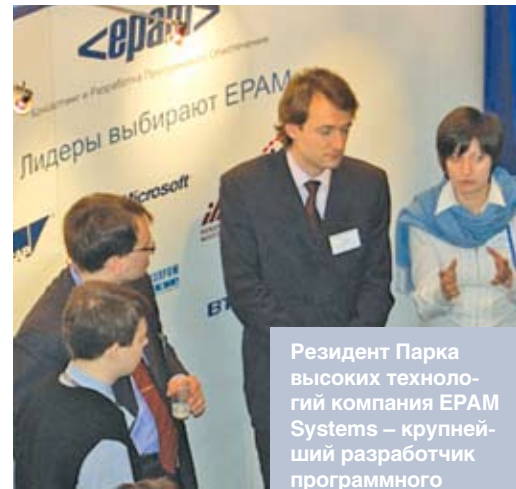
Резидент Парка высоких технологий компания EPAM Systems – крупнейший разработчик программного обеспечения в Восточной Европе