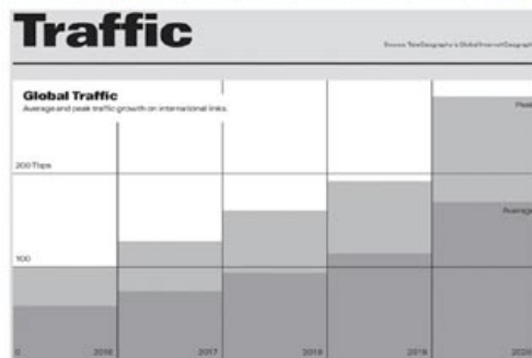
Рисунок 1. Пандемия и рост интернет-трафика