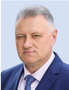
Іван САВЕРЧАНКА, доктар філалагічных навук, прафесар

Іван САВЕРЧАНКА. Інтэлектуальная культура Беларусі эпохі Рэнесансу і барока. Асветлена багатая інтэлектуальная культура Беларусі XVI–XVII стагоддзяў, выяўлены галоўныя тэмы і праблемы, што ўздымаліся ў палемічных і публіцыстычных творах. Паказаны ключавыя аспекты дыскусій і лініі ідэйнай барацьбы паміж пісьменнікамі-інтэлектуаламі, прадстаўнікамі розных філасофска-рэлігійных плыняў. Раскрываецца паэтыка і семіётыка старабеларускай публіцыстычнай літаратуры, выяўлены яе асноўныя мастацка-эстэтычныя і жанравыя формы. Вызначаны семантычныя дамінанты і структурна-кампазіцыйныя кампаненты публіцыстычных твораў, акрэслены прынцыпы і ўстойлівыя заканамернасці ўнутранай арганізацыі публіцыстычнага дыскурсу.