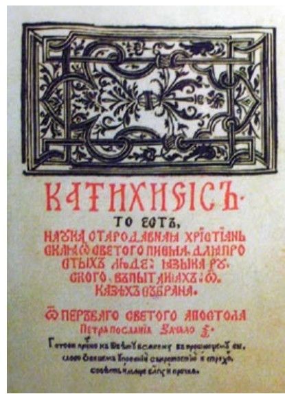
«Катэзіс» Сымона Буднага, выдадзены ім у Нясвіжы ў 1562 годзе

старажытнасць выявілася на ўзроўні будовы (вылучэнні тыповых раздзелаў, іх назваў і топікі), унутранай мастацка-кампазіцыйнай структуры і нават у назвах канкрэтных твораў, у якіх пераважала грэцкая або рымская моўная аснова («антырызіс», «антыдотум», «апокрысіс», «антыграфі», «апалогія», «верыфікацыя», «сінопсіс»).