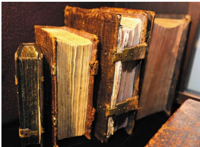
Публіцыстыка XVI–XVII стагоддзяў – унікальная з’ява нацыянальнай культуры

Прыхільнікі законнасці і панавання ў грамадстве права сфармулявалі і абгрунтавалі ў сваіх трактатах (С. Будны, А. Валовіч, Л. Сапега) вельмі важны для таго часу прававы прынцып адпаведнасці юрыдычных нормаў вучэнню Ісуса Хрыста і новазапаветнай хрысціянскай этыцы. Выказаныя імі ідэі мелі велізарнае ўздзеянне на юрыстаў-практыкаў і тых, хто выпрацоўваў канкрэтныя статутаўныя артыкулы. Асаблівая роля належала выдатнаму публіцысту, дзяржаўнаму дзеячу, праўніку еўрапейскага ўзроўню Л. Сапегу [8], які ў сваёй творчасці сінтэзаваў найгалоўнейшыя набыткі палітычна-прававой думкі XVI стагоддзя.