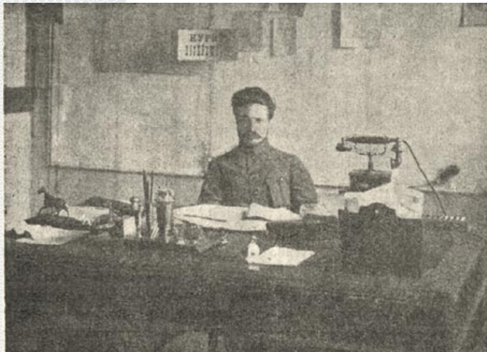
▲ М.В. Фрунзе (Міхайлаў) начальнік мінскай міліцыі

ту работы на адказную пасаду патрабуе тлумачэння.