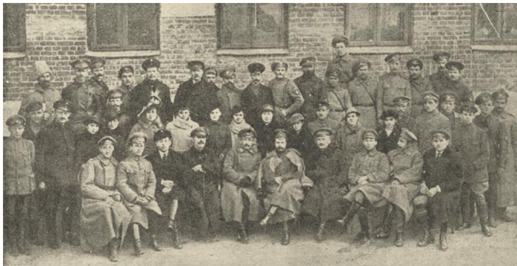
◀ Група работнікаў мінскай міліцыі. 1917 год

пазбавілі жыцця бацьку і сына Тушынскіх, чый дом знаходзіўся на Камароўцы. Яўрэйскае насельніцтва горада скаланулася ад забойства, якое адбылося ў ноч на 19 мая, калі разбойнік-кітаец засек сякерай 73-гадовага пекара Абрама Каплана, яго жонку і дзвюх дачок. Раніцай 7 ліпеня суседзі па кватэры на Багадзельнай вуліцы знайшлі труп прадпрымальніка Нохім-Бера Цукермана з перарэзаным горлам. Некалькі сотняў мінчан 4 верасня прыйшлі на яўрэйскія могілкі, дзе хавалі 66-гадовага арандатара Хайма Ліўшыца, забітага разбойнікамі разам з дачкой і сынам [17, с. 3].