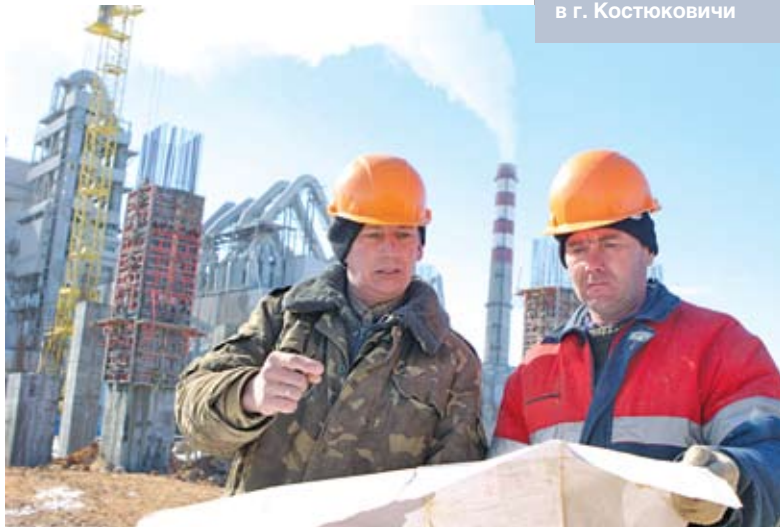
Строительство второй технологической линии на ПРУП «Белорусский цементный завод» в г. Костюковичи

отрасли. Это вполне объяснимо. Поскольку основной прирост ВВП в развитых странах определяется технологическим прогрессом, инновации становятся неременным спутником экономического роста. Таким образом, в качестве ключевого элемента его новых движущих сил определены внедрение инновационных технологий во всех сферах жизнедеятельности человека и структурная перестройка экономики на базе повышения доли высокотехнологичных производств. Это и должно лечь в основу упомянутого расширения выпуска продукции с высокой добавленной стоимостью.