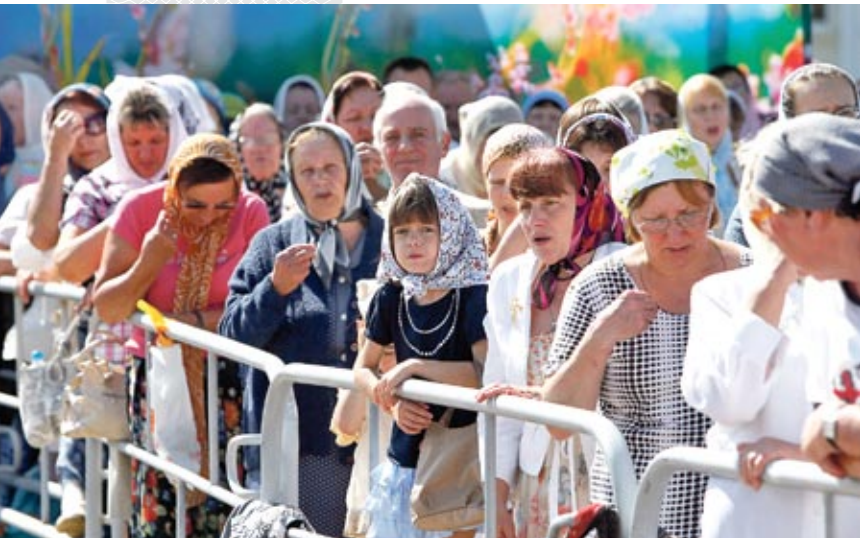
▲ На Божественную литургию под открытым небом в центре Минска собрались тысячи людей. 2013 год

далеко не все считающие себя православными, католиками или протестантами являются верующими. Для современного человека утверждать, что «я православный» или «я католик» совершенно не означает «верить в Бога». Причисляя себя к определенной конфессии, он может иметь в виду приверженность ее традициям, этническую идентичность, объединение с группой единомышленников – «своих» в противовес «чужим» [1; 2]. Так кто же является истинно верующим? Ответить на этот вопрос помогают социологические модели.