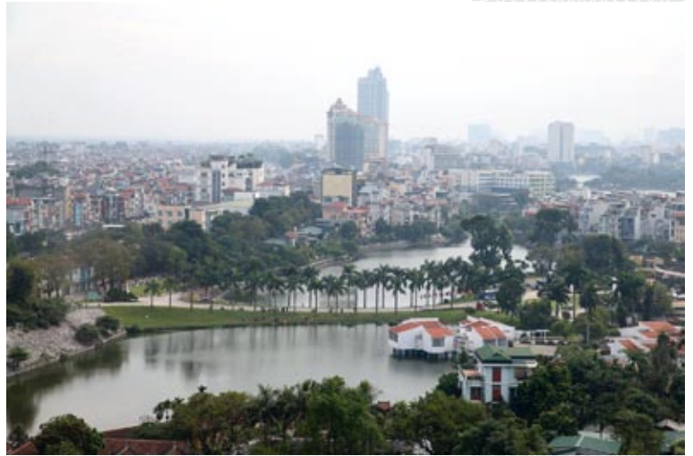
▲ Ханой – столица Вьетнама

Заметным и успешным шагом в повышении инвестиционной привлекательности СРВ стали созданные в 1995 году совместные предприятия по перевозкам грузов, такие как Ханой – Пекин, Гуанси – Вьетнам. Китайские иностранные предприятия начали заниматься производством фруктовых соков, нектаров и напитков (Хон Ян Общество), бумаги и банковского оборудования (Хайфон). Более активно развивается строительная индустрия. Около 340 проектов в строительной отрасли было предложено