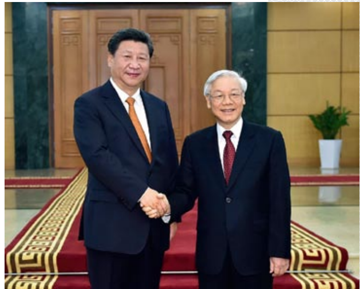
▲ Генеральный секретарь ЦК КПК, председатель КНР Си Цзиньпин и Генеральный секретарь ЦК КПВ Нгуен Фу Чонг. Ханой, 2015 год

Большой вклад в увеличение взаимной торговли вносит ее приграничная составляющая, способствующая развитию наиболее отсталых провинций КНР и СРВ. Расширение приграничной торговли в со-