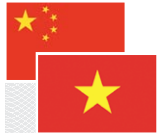
▼ Столица КНР Пекин

Предприятия по производству китайских товаров бытового потребления планомерно начали появляться как в различных странах мира, так и на территории Вьетнама. В 1999 году китайская компания TCL открыла свой первый зарубежный завод именно в этой стране. В 2010 году продажи ее цветных телевизоров во Вьетнаме достигли 3 млн единиц, что составило 16 % всего вьетнамского рынка. В этом отношении TCL уступает только Samsung и LG (в дельте Меконга объем продаж TCL превзошел LG). Компания Midea Group инвестировала в 2006 году 25 млн долларов в про-