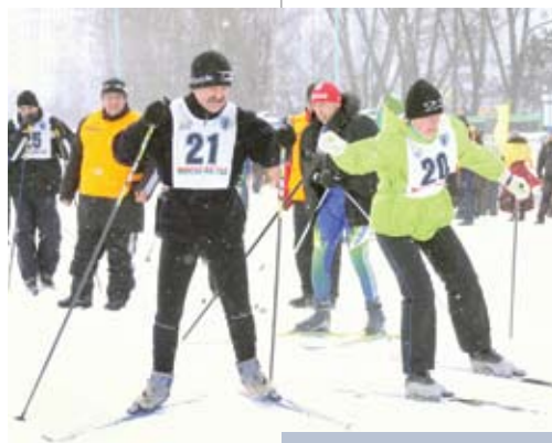
Команда администрации Московского района участвует в спортивном празднике «Минская лыжня – 2011»

К ожгалантерейная продукция с фирменным логотипом «Галантэя» – сумки, портфели, чемоданы, ремни – хорошо известна и в Беларуси, и в других странах. Предприятие, отметившее в 2009 году свое 85-летие, всегда работало стабильно, в 1990-е годы помещалось на Республиканскую доску Почета, два последних года – на Доску почета Московского района. По итогам 2010 года объем продукции при рентабельности 15 % в сопоставимых ценах вырос на 9,7 %, экспорт – на 13,1 %. А идеологическая работа на ОАО «Галантэя» признана лучшей в городе среди предприятий с численностью работающих до 1000 человек.