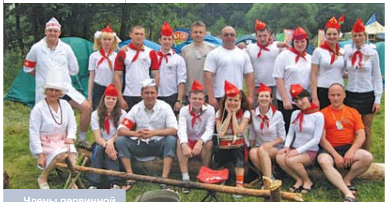
Члены первичной организации БРСМ Белагропромбанка участвуют в республиканском молодежном туристическом слете «Олимпия». Июнь 2010 года

Когда-то мы ставили задачу раз в месяц проводить какое-либо значимое мероприятие в масштабах всего банка, сегодня таких мероприятий ежемесячно проводится несколько, и если сложить вместе все планы Управления по работе с персоналом и наших общественных объединений, то это более десятка страниц мелким шрифтом.