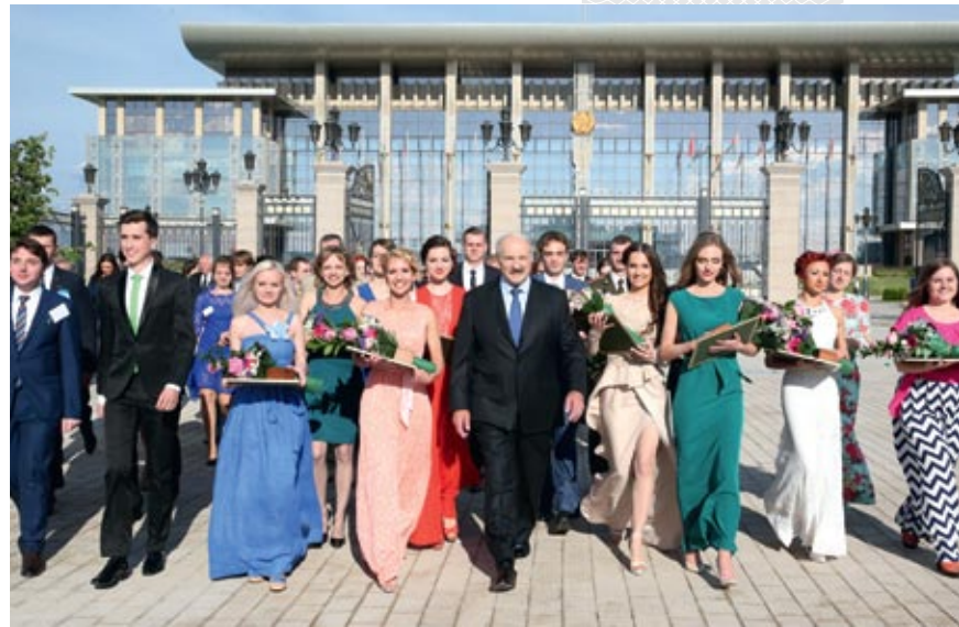
▲ Президент Беларуси А.Г. Лукашенко с выпускниками высших учебных заведений. 2015 год

Действительно, опыт большинства постсоветских стран за прошедшие годы показал, что порядок и прогресс наблюдаются только в тех из них, где есть сильная и несменяемая власть. И, напротив, там, где постоянно идет борьба за власть, происходят непрерывные парламентские битвы, дается ход «цветным революциям» и «майdanам»,