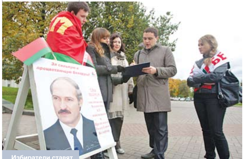
Избиратели ставят подписи в списках по выдвижению Александра Лукашенко кандидатом в президенты Беларуси. Минск, октябрь 2010 года

влияния на противников с целью вызвать определенные действия или создания условий для разрушения ненавистного режима... Такое оружие хорошо известно – это протест, забастовка, отказ в сотрудничестве, бойкот, выражение недовольства и народное самоуправление. Любое правительство может править постольку, поскольку оно способно пополнять необходимые источники силы путем сотрудничества, подчинения и послушания со стороны населения и общественных институтов... Политическое неповиновение обладает уникальной спо-