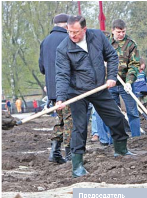
Председатель Брестского облисполкома Константин Сумар участвует в республиканском субботнике. Апрель 2010 года

Итог мирной революции 1994 года – постоянный экономический рост, обновление основных производственных фондов, повышение благосостояния народа. Подтверждением тому служит один из самых высоких в мире среднегодовой темп экономического развития нашей страны за прошедшее пятилетие (выше он только у 12 стран). Кстати, Беларусь – одна из немногих стран в мире, самодостаточная, полностью независимая в производстве стратегически важной продовольственной продукции. Вполне закономерно, что белорусские продовольственные товары присутствуют в 63 странах мира.