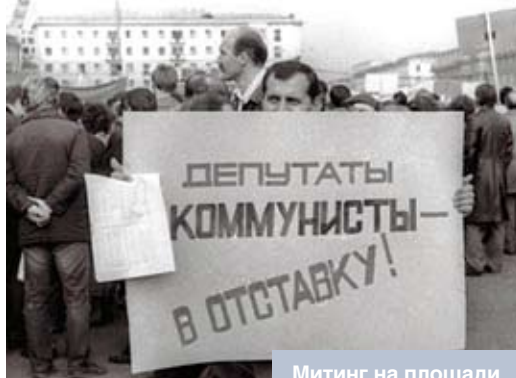
Митинг на площади Независимости в Минске. Осень 1991 года

Тем не менее, именно такая соглашательская политика в перспективе непременно привела бы к власти отъявленных националистов – с вытекающими отсюда последствиями для страны. Говорят, после известных августовских событий 1991 года С. Шушкевич пытался вразумлять ради-