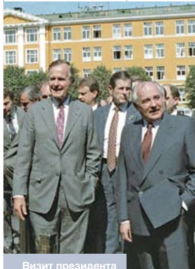
Визит президента США Джорджа Буша в Москву. Июль 1991 года

Итоги развала хорошо известны. Для нашей республики он был беспрецедентным по последствиям. Беларусь, занимавшая ведущее место по уровню развития, макроэкономическим показателям и качеству жизни, в одночасье осталась без всего: без золотого запаса, без нефти и газа. Страна оказалась перед пропастью с реальной перспективой ликвидации провозглашенного суверенитета и независимости и угрозой существованию белорусского народа. Разрыв советских связей нанес тяжелейший удар по высокоразвитой промышленности. Пустые полки магазинов, нехватка еды, карточная система и покупка товаров