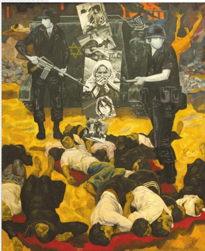
▲ Третья картина из триптиха «Агрессия» Михаила Савицкого

взгляде на полотно зритель отмечает, что изображены не конкретные места, где проходили исторические события. Фактически М. Савицкий изображает понятия насилия, агрессии, оккупации и для этого находит уникальные художественные приемы. Он отказался от аллегорического и метафорического языка, достаточно разработанного в искусстве. Другими словами, художник поставил перед собой сложную задачу в рамках трех картин в образной форме отобразить и конфликты современности, и сам феномен агрессии как таковой, что ему блестяще удалось.