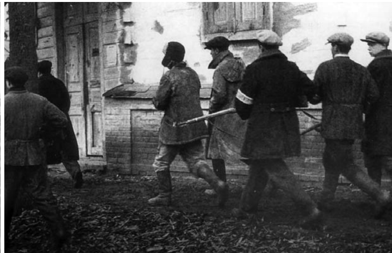
В Минском гетто гитлеровцы уничтожили более 105 тысяч человек

шегубку. Затем машина медленно ехала по улицам Минска в сторону концентрационного лагеря в Малом Тростенце. В конце пути нелюдям оставалось только выгрузить детские трупы в заранее выкопанный ров. Затем «газенваген» возвращался... За день из гетто ко рву фашисты совершали по несколько рейсов.