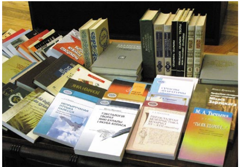
Гістарычныя, тэарэтычныя і тэксталагічныя даследаванні беларускіх літаратуразнаўцаў