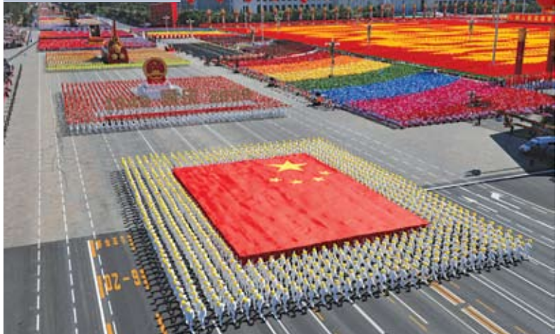
Парад на площади Тяньаньмэнь в Пекине в День образования Китайской Народной Республики

Путь мирного развития, по которому мы неуклонно идем, – это качественно новый путь развития страны, выдвинутый руководящим коллективом ЦК, Генеральным секретарем которого является Ху Цзиньтао, на основе глубокого понимания характера эпохи и особенностей страны, учета внутренних и внешних факторов, в увязке анализа и сопоставления опыта других держав. Этот путь представляет собой чрезвычайно важный выбор по стратегии развития страны, в то же время он является и важной демонстрацией внешнеполитической стратегии Китая.