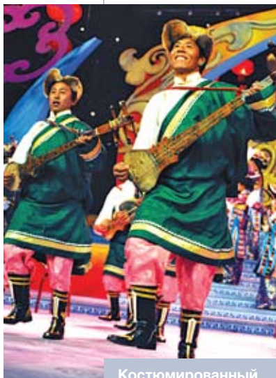
Костюмированный праздник в честь наступления Нового года по тибетскому календарю

международную среду. Таким образом, по словам Дэн Сяопина, «наш социализм – это социализм, который непрерывно развивает общественную производительность труда, это социализм, который выступает за мир». С другой стороны, путь мирного развития – это важная составляющая социализма с китайской спецификой. Свое выражение социализм с китайской спецификой находит на многих направлениях и во многих сферах, будь то экономика, политика, культура или общество и экология. Социализм с китайской спецификой мы называем во внешней сфере курсом мирного развития. Иначе говоря, путь мирного развития как нельзя лучше отражает основные признаки, основные особенности, основное содержание и направление социализма с китайской спецификой на внешнеполитическом поприще. Высоко нести знамя социализма с китайской спецификой на международной арене – это значит нести знамя мира, развития и сотрудничества, значит быть убежденным приверженцем пути мирного развития. Это вывод, к которому наша партия пришла в результате анализа общей ситуации мирового развития, осмысления опыта и уроков развития отечественного и зарубежного. Это важнейшее достижение адаптации марксизма к китайским реалиям и к духу времени, крепкая гарантия осуществления научно-обоснованного развития в столь сложной международной обстановке.