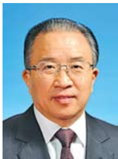
Дай БИНГО, член Госсовета КНР

Китай будет и впредь высоко держать знамя мира, развития и сотрудничества, придерживаться независимой, самостоятельной и мирной внешней политики, неуклонно идти по пути мирного развития, продолжать проводить стратегию внешней открытости во имя взаимных интересов и общего выигрыша, защищать свой государственный суверенитет, национальную безопасность и интересы собственного развития и вместе со всеми странами мира строить гармоничный мир с прочным миром и всеобщим процветанием. Так говорится во внешнеполитическом разделе Предложений ЦК по выработке 12-го пятилетнего плана социально-экономического развития Китая, принятых на 5-м Пленуме ЦК КПК 17-го созыва. Это и есть наше четкое и ясное толкование того, под каким знаменем и по какому пути Китай будет идти дальше, какие цели он преследует во внешней политике и каким образом будет их осуществлять, что имеет крайне актуальную важность и далеко идущее историческое значение для внешнеполитической работы Китая в новое время.