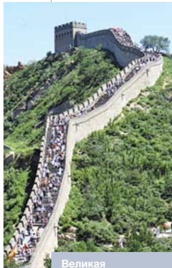
Великая Китайская стена

Не быть главой, не претендовать на гегемонию и не возвеличивать себя до гегемона – это основная государственная политика и стратегический выбор Китая. Угрожает ли миру какая-либо страна, можно судить по той политике, которую она проводит. Мы неизменно руководствуемся пятью принципами мирного сосуществования, уважаем право народов всех стран на самостоятельный выбор пути развития, исключительно не почитаем себя неограниченным властителем и не намереваемся доминировать над миром и обижать других. Товарищ Дэн Сяопин в свое время сказал,