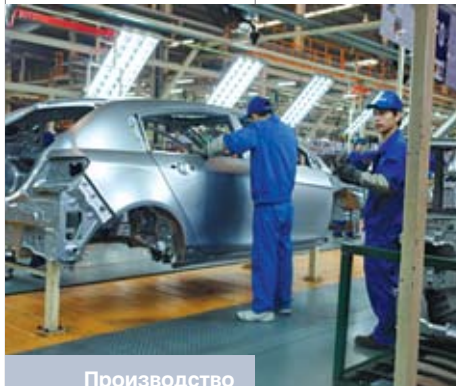
Производство автомобилей марки Geely на заводе в г. Тайчжоу

И даже в тот день, когда Китай по душевому ВВП приблизится к уровню США, Европы, Японии и других западных стран, мы все же будем далеки от них по качеству экономики и качеству жизни.