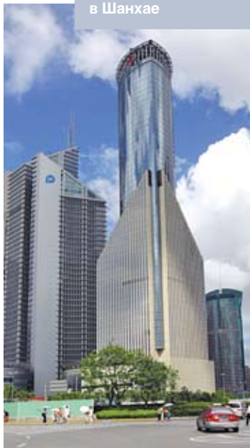
Небоскребы в Шанхае

было бы приветствовать, а не бояться, помогать, а не препятствовать, поддерживать, а не сдерживать мирное развитие Китая, с пониманием и уважением относиться к нашим справедливым и рациональным интересам.