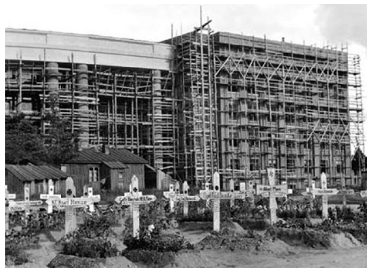
Магільныя крыжы нямецкіх ваенных на фоне будынка Акадэміі навук у акупаваным Мінску. 1942 год

– Новай дамінантай сфарміраванага на працягу стагоддзя архітэктурнага ансамбля Нацыянальнай акадэміі навук Беларусі і стала архітэктурна-мастацкая кампазіцыя «Залатое кольца беларускай навукі», – упэўнены Армэн Сардараў. – Яе мастацка-стылістычнае вырашэнне адпавядае неакласічнаму афармленню праспекта Незалежнасці, пераклікаецца з архітэктурным стылем будынка Прэзідыума НАН. На маю думку,