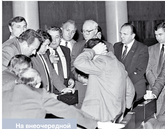
На внеочередной шестой сессии Верховного Совета БССР. Сентябрь 1991 года

означает кризис парламентаризма». Но подобного утверждения в книге нет. Речь идет о том, что в 1996 году кризис парламентаризма в Беларуси основывался на том, что ни Верховный Совет XII созыва, ни Верховный Совет