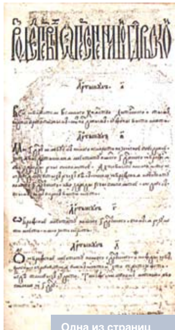
Одна из страниц Статута Великого княжества Литовского 1588 года

Кстати говоря, последнее утверждение оппонентов не раз было подвергнуто критике еще со времен Ж.-Ж. Руссо, ибо, как известно, весь народ не может усесться в правящее кресло. Не случайно и статья 3 Конституции Республики Беларусь не ограничивается утверждением о том, что «единственным источником государственной власти и носителем суверенитета в Республике Беларусь является народ», а конкретизиру-