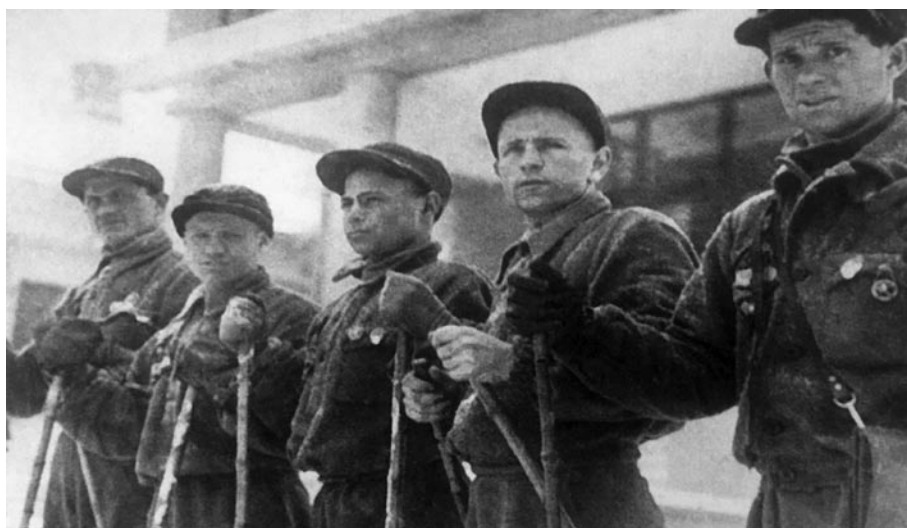
Белорусские лыжники. 1936 год

На III съезде БелОГ, который состоялся в июне 1940 года, отмечались недостатки культурно-массовой работы с глухими, которая ограничивалась городскими отделами, игнорируя работу с глухими, проживавшими в сельской местности. С целью их устранения Совет народных комиссаров БССР 18 января 1941 года принял постановление «Об организации