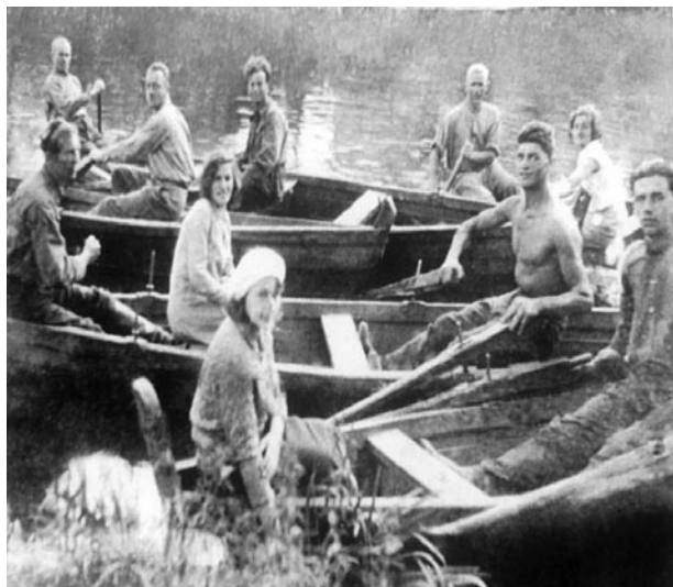
Спортсмены-дефлимпийцы. 1930-е годы