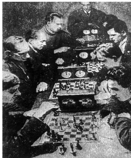
Первый Всебелорусский шахматный турнир глухонемых в Минске. 1936 год

областных отделов Белорусского объединения глухих». В результате в 16 городских и районных отделах и 24 районных ячейках объединения усилилась спортивно-массовая работа.