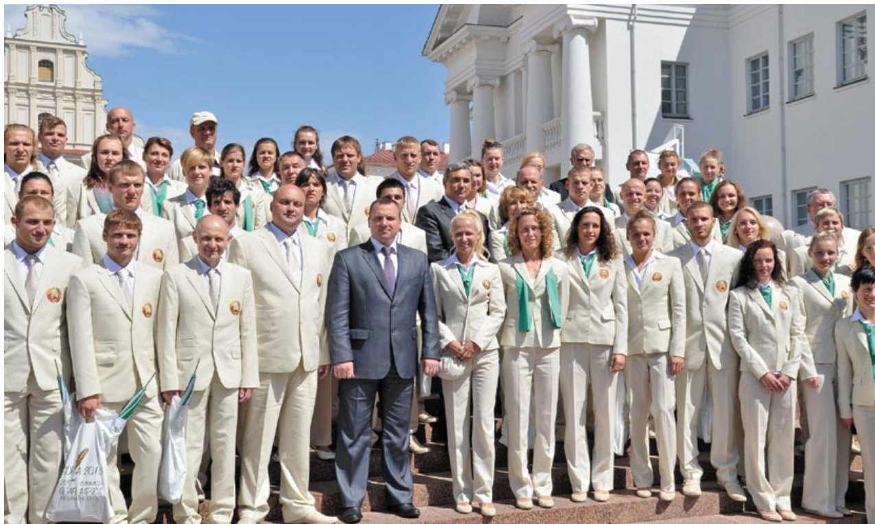
Команда белорусских спортсменов – участников Дефлимпийских игр в Болгарии летом 2013 года

коллективов предприятий БелОГ. Было подготовлено 730 разрядников, кандидатов и мастеров спорта, четыре мастера спорта международного класса, четыре человека получили звание «Заслуженный мастер спорта Республики Беларусь», два – «Заслуженный тренер Республики Беларусь» [19].