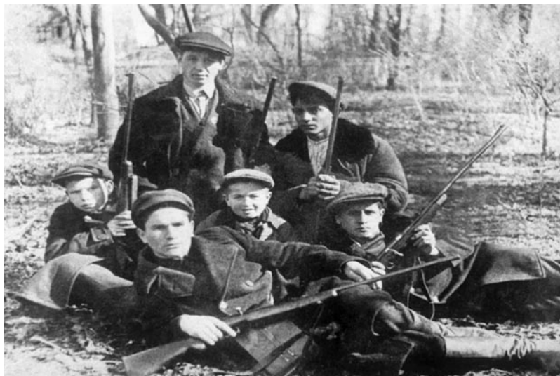
Стрелки – члены ОСОАВИАХИМ. 1930-е годы