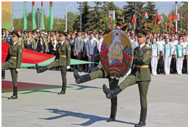
14 мая 2023 года. Площадь Государственного флага. Торжественный ритуал чествования государственных символов

Имеются в виду те песни, где он автор и текста, и музыки. Многие из них глубоко патриотичны. Например, «Беларусь мая сiнявокая», которую, по словам поэта, исполнял не только хор Цитовича, но и квартет «Купалiнка».