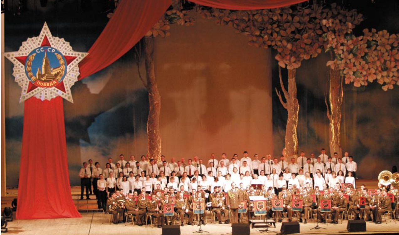
Финальное прослушивание 8 мая 2002 года во Дворце Республики, в ходе которого Президент Александр Лукашенко ознакомился с произведениями, претендующими стать Государственным гимном Беларуси

почему. В музыке, как и других сферах, есть свои законы.