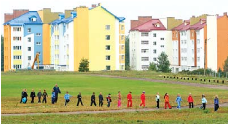
Новостройки в агрогородке Новая Гута Гомельского района

Белорусскому крестьянину, постоянно ощущающему поддержку государства и кормящему собственный народ, трудно понять такую политику. Но это – необратимые и все более обостряющиеся реалии сегодняшнего дня: речь идет уже о самом существовании крестьянства в нашей стране.