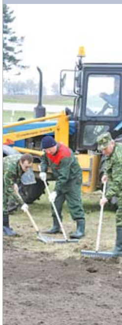
На республиканском субботнике