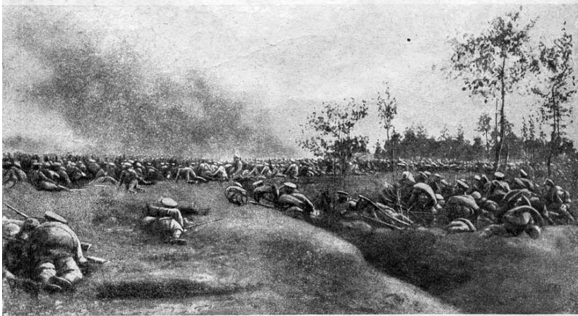
Начало атаки. Переднія линіи резерва готовятся къ наступленію.

Рядки фотографіи съ театра войны, сделанныя корреспондентомъ «Огонька».