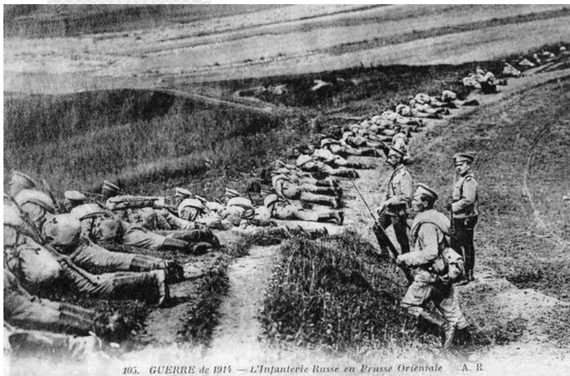
105. GUERRE de 1914 — L'Infanterie Russe en Prusse Orientale — A. B.