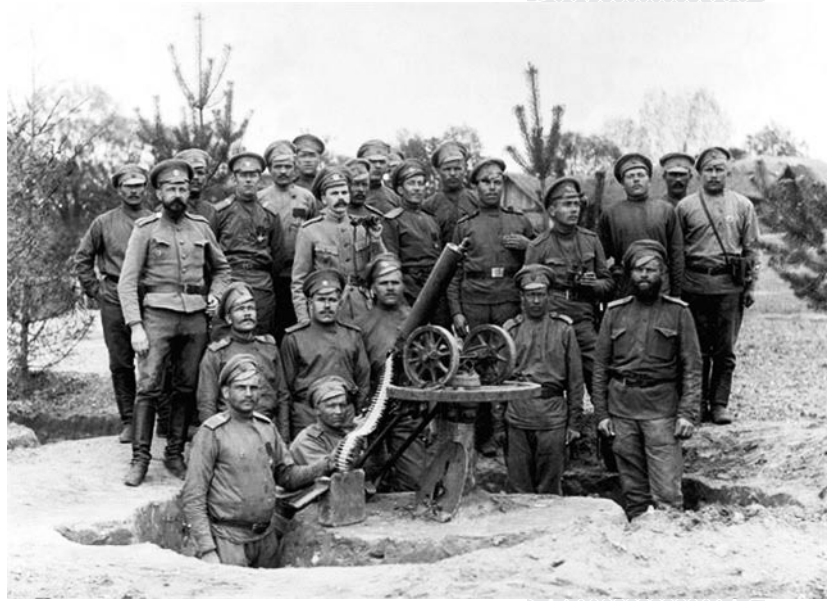
▲ Пулеметная команда 303-го Сенненского полка в районе Гродно. 1914 год

28–30 июля побатальонно выполнялись упражнения по стрельбе, производилась «подготовка звена, отделения и взвода, ротные строевые и тактические занятия». Завершающей была «тактическая батальонная учеба» на «участке от предместья Луполово... до р. Днепр». В ходе учений командованием была отмечена «большая отсталость нижних чинов в знании обязанностей стрелка в цепи, отдельного и взводного командиров». «Много труда было положено на урегулирование движения при наступлении, запасные, по старой привычке, стремились делать быстро, но быстрота была беспорядочна, появлялось сразу много мишеней над цепью, делали большие перебежки». «Не на высоте положения в знании уставов оказались прибывшие в полк прапорщики. Большинство из них объясняют