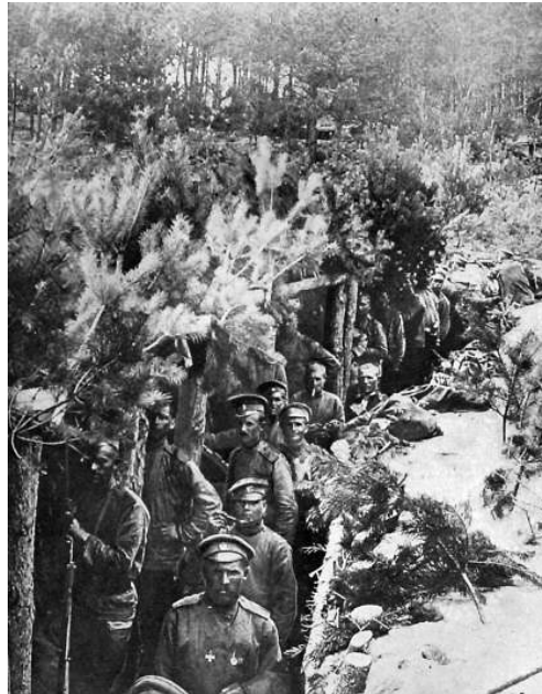
◀ Русские окопы

К вечеру 26 августа австро-венгры, теснимые наступавшей гвардейской бригадой вдоль правого берега Вислы, стали отступать. Батальоны 300-го Заславского полка содействовали гвардейцам своим пулеметным огнем, нанося противнику большие потери. «Ночью был слышен шум,