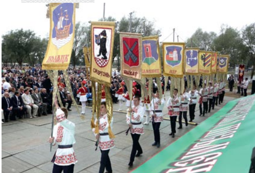
▼ Торжественная церемония открытия XXII Дня белорусской письменности в Щучине. 2015 год

– На Ваш взгляд, какими достижениями отмечено последнее двадцатилетие, когда происходило становление суверенной Беларуси?