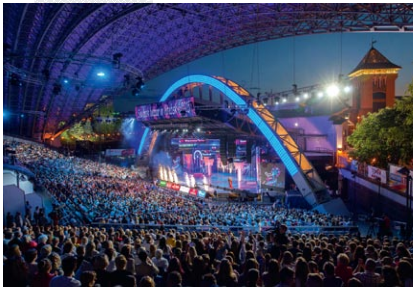
▲ На XXIV Международном фестивале искусств «Славянский базар в Витебске». 2015 год

неудобные вопросы – кто я такой? зачем живу? А включил «техно» – и не надо ни о чем говорить, ни о чем думать.