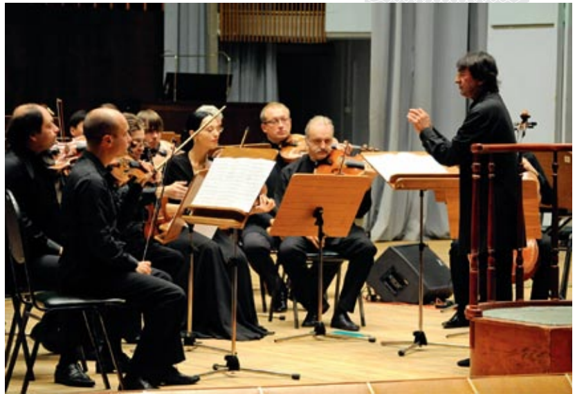
▲ Во время концерта IX Международного фестиваля Юрия Башмета. Минск, 2014 год

Специальный фонд Президента по поддержке культуры и искусства, председателем которого я являюсь, практически сворачивает свое существование по ряду независимых от него причин. Отсутствуют глобальные творческие проекты, никто не подает интересных заявок, просят, скажем, купить баян, приобрести картину в музей или пошить костюмы – это что, уровень специального фонда Президента?!