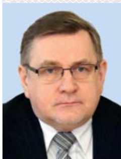
Геннадий ДАВЫДЬКО, председатель Национальной государственной телерадиокомпании Республики Беларусь

Состояние современной культуры характеризуется понятием «техногенная цивилизация». Останется ли место в этом большом мире новых технологий и гаджетов, развивающихся порой вне социокультурного, человеческого измерения, для уникальных и самобытных национальных культур? Нужно ли государству артикулировать приоритеты в ценностной шкале? Какова роль интеллигенции и самого народа в становлении белорусского государства и общества, в этнической и культурной идентификации? И, наконец, должны ли журналисты консолидировать общество, формировать не только объективную, но и активную гражданскую позицию у своих читателей? Пробуем прояснить и осмыслить эти вопросы в беседе с председателем Белтелерадиокомпании Геннадием ДАВЫДЬКО.