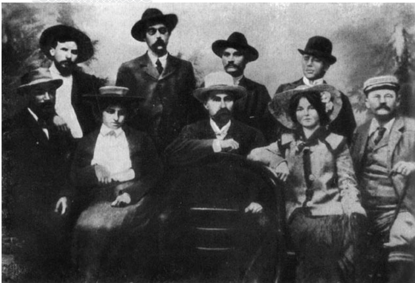
▼ Г. Плеханов (в центре) среди агентов «Искры»

Решением съезда участники плехановского союза были объявлены «членами партии РСДРП» [1, с. 157]. Таким образом, Г. Плеханов и в теоретическом, и в практическом смысле стал «начинателем» – это слово русский марксист позаимствовал в западной литературе. Им он называет «великих людей», что прослеживается, в частности, в его работе «К вопросу о роли личности в истории», опубликованной в 1898 году. Стал ли к этому времени великим человеком сам Г. Плеханов? В упомянутой работе он на примере Наполеона утверждает: для того чтобы стать великим человеком, необходимы соответствующие общественные условия [2, т. 2, с. 328, 333].