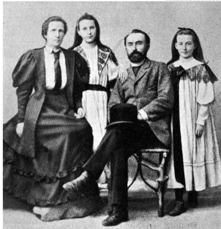
▲ Г. Плеханов с женой и дочерьми. Начало 1890-х годов