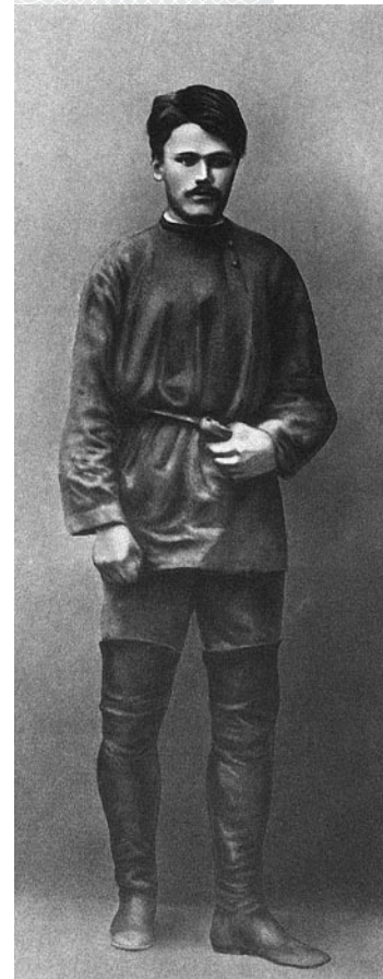
▲ Г. Плеханов в костюме рабочего. 1870-е годы