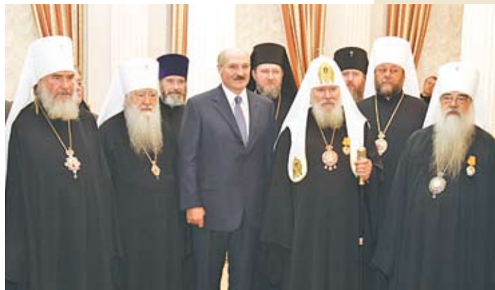
Во время последнего визита Патриарха Московского и всея Руси Алексия II в нашу страну. Октябрь 2008 года

П одписание Акта о каноническом общении стало результатом возникшего между Церковью в Отечестве и русским церковным рассеянием взаимопонимания и