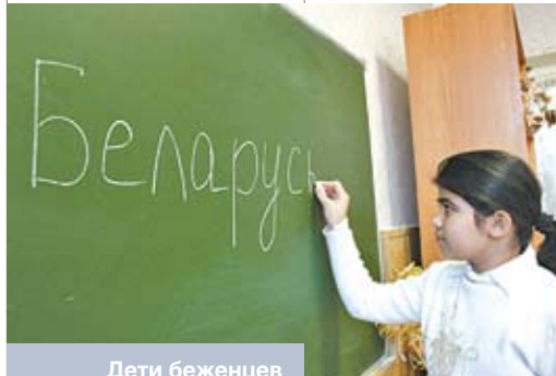
Дети беженцев учатся в средней школе № 19 г. Витебска