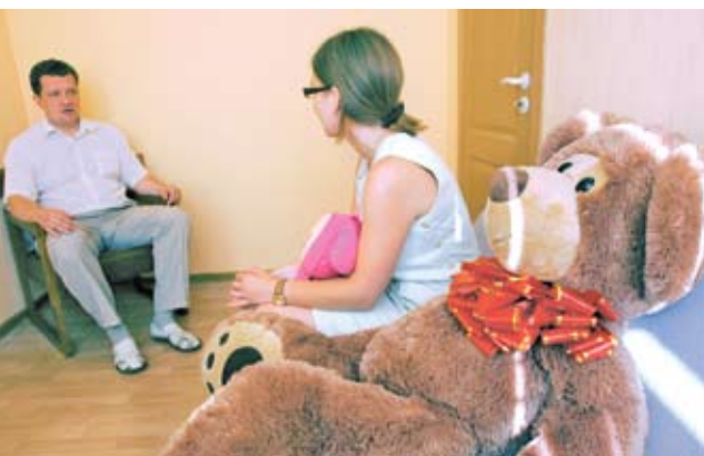
Первая в Беларуси комната опроса детей – жертв насилия и торговли людьми в Минске. 2009 год

Большое внимание Центр намерен уделять информационной поддержке поисковых мероприятий. С этой целью планируется создать собственный веб-сайт. Особый акцент намечено делать на оперативном информировании средств массовой информации, в том числе электронных. Имеется немало положительных примеров, когда люди находились достаточно быстро после