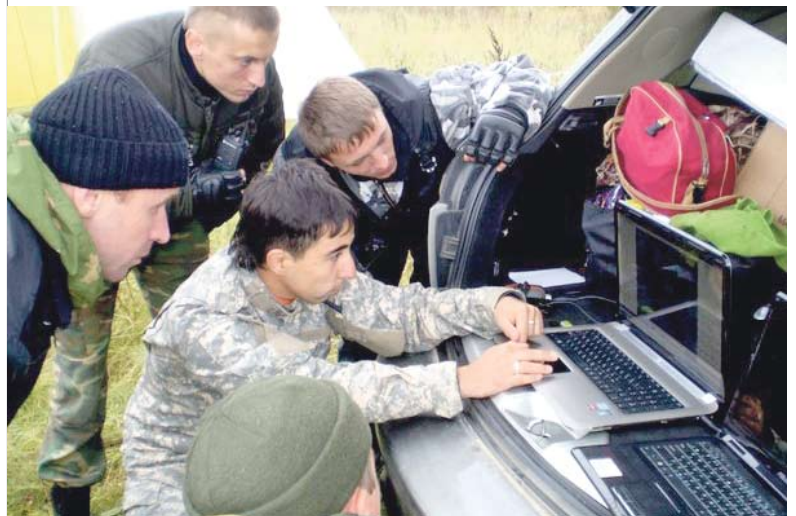
На учениях по поиску потерявшихся в лесу. 2012 год