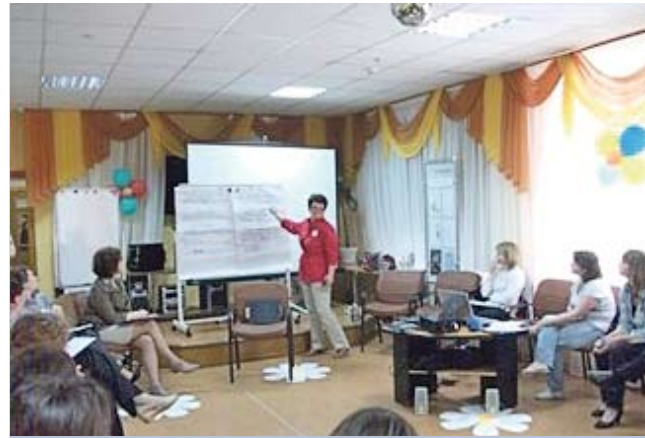
Обучение специалистов в Нижегородском ресурсном центре «Детство без насилия и жестокости»

совершают побеги из дома и интернатных учреждений, подвергаются насилию в семье, школе и других институтах общества. Рассматривается и возможность оказания в будущем психологической и юридической помощи родителям детей – жертв насилия и безвестно исчезнувших детей. В Центре рассчитывают, что значительную научно-методическую помощь в организации этой работы в дальнейшем ему сможет оказать Нижегородский ресурсный центр «Детство