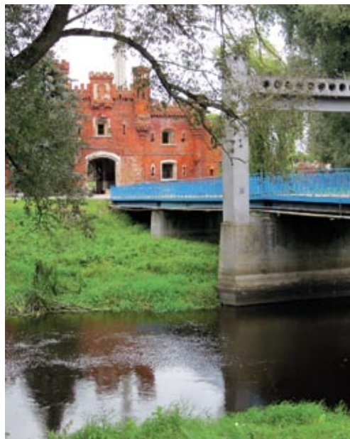
► Вид на Холмские ворота

В июне 1961 года впервые состоялась встреча защитников Брестской крепости – по случаю 20-летия героической обороны цитадели в город над Бугом приехали более 100 оставшихся в живых воинов гарнизона 1941 года, члены их семей, родные погибших. На митинге с их участием руководством Беларуси было одобрено предложение о постройке в Брестской крепости памятника, а в подтверждение серьезности намерений на месте будущего монумента установили закладной гранитный камень. Тогда же была торжественно открыта новая экспозиция музея обороны Брестской крепости.