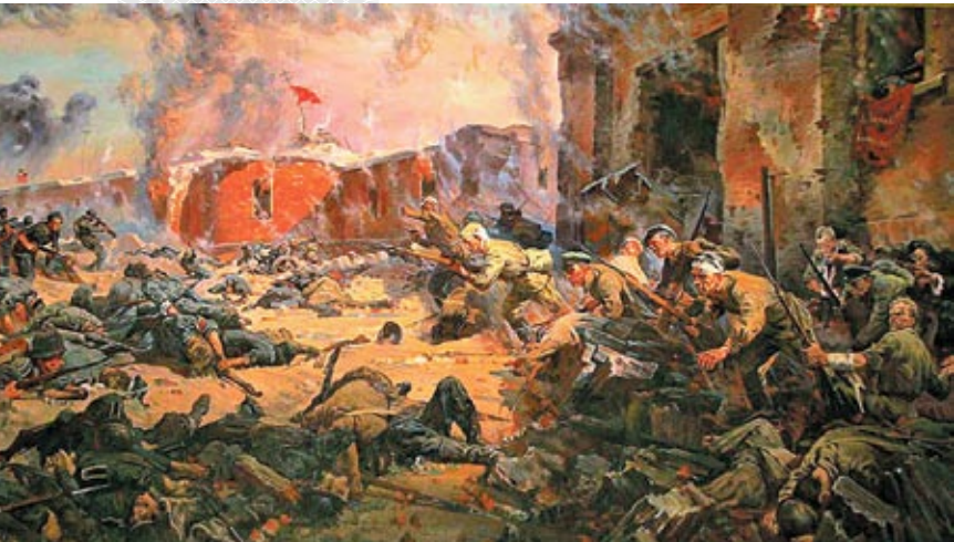
▼ Фрагмент картины П. Кривоногова «Защитники Брестской крепости». 1951 год

Накануне войны непосредственно в Брестской крепости размещались части 6-й и 42-й стрелковых дивизий 28-го стрелкового корпуса, 33-й отдельный инженерный полк окружного подчинения, 132-й отдельный батальон конвойных войск НКВД, подразделения 17-го Краснознаменного пограничного отряда, курсы шоферов Белорусского пограничного округа, а также часть военнообязанных сборов приписного