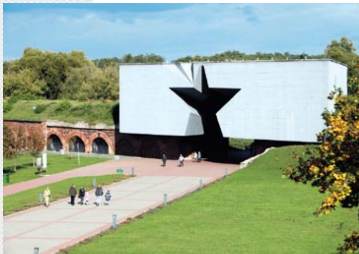
▼ Главный вход в мемориальный комплекс «Брестская крепость-герой»

День ото дня осада крепости становилась все более ожесточенной. Враг применял тяжелую артиллерию, использовал огнеметы, подрывал стены и подвалы казарм и казематов. В такой обстановке защитники крепости в ночь на 27 и 28 июня предприняли попытку прорыва. Однако из осажденной крепости уйти смогли только отдельные