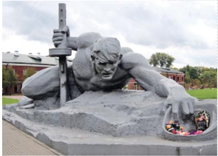
▲ Скульптурная композиция «Жагда»

В послевоенное время местные жители много рассказывали о стойкости защитников крепости. Одну из таких историй в 1956 году поведал писателю С. Смирнову,