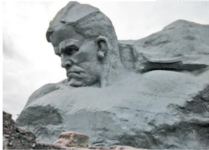
▲ Монумент «Мужество»

Существует масса свидетельств о событиях раннего утра 22 июня 1941 года у стен Брестской крепости и с немецкой стороны. Так, пастор 45-й пехотной дивизии Р. Гшепф в книге «Мой путь с 45-й пехотной дивизией» позднее вспоминал: «Ровно в 3.15 (по берлинскому времени. – С.Г.) начался ураган и пронесся над нашими головами с такой силой, какую мы ни разу не испытывали ни до этого, ни во всем последующем ходе вой-