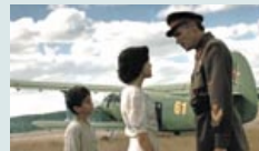
«В июне 41-го» «Киноальянс» (Россия) – Juja Films (США), 2003

зами. – Он как-то обмолвился, что крик плачущей птицы, так он его называл, был для него звуком смерти.