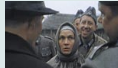
«Знак беды» «Беларусьфильм», 1986