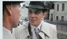
«Наш бронепоезд» «Беларусьфильм», 1988