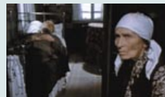
«Возьму твою боль» «Беларусьфильм», 1980