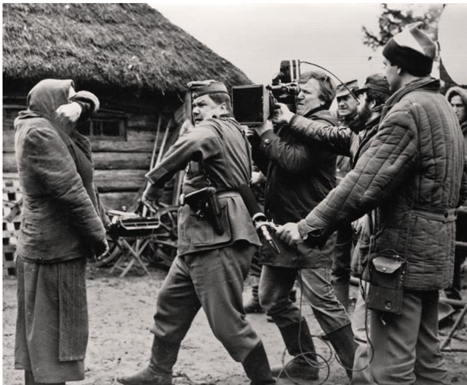
Режиссер сам часто брал в руки камеру. На съемках фильма «Знак беды». 1986 год