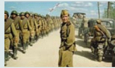
«В августе 44-го...» «Беларусьфильм», 2000