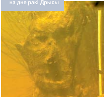
Здымак расонскага ідала на дне ракі Дрысы

Пэўную інфармацыю пра колішнія размяшчэнне ў тым ці іншым рэгіёне паганскіх капішчаў могуць даць як тапонімы, так і мясцовыя легенды і паданні. Звычайна назвы ўрочышчаў кшталту Красная ці Перунова гара, Святы камень, Валова возера і інш., а таксама легенды пра ўзгоркі, на якіх стаялі цэрквы ці касцёлы, што праваліліся пад зямлю, паказваюць на існаванне ў тых мясцінах дахрысціянскіх культавых аб'ектаў. Наколькі распаўсюджаны такога кшталту мікратапонімы ў наваколлі Амосенак і ці бытуюць сярод іх жыхароў паданні пра зніклыя пад зямлёй храмы? Дакладных адказаў на гэтыя пытанні навукоўцы пакуль не даюць. Патрэбны асобныя фальклорныя даследаванні.