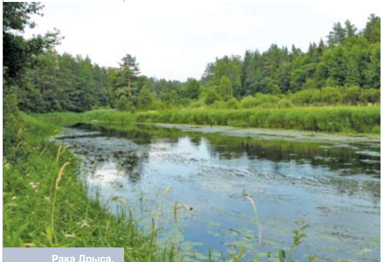
Рака Дрыса, дзе быў знойдзены расонскі ідал

Зыходзячы з той вялікай ролі, якая была адведзена Перуну ў дахрысціянскіх ве-