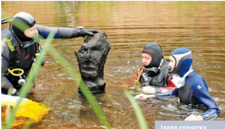
Ідала спачатку сплавілі на мелкаводдзе, а потым ужо даставалі з вады

Між тым, добрая захаванасць наогул не характэрная для знойдзеных археолагамі выяў паганскіх ідалаў. Праўда, не ўсіх, а толькі – Перуна. Звязана гэта з той вялікай роляй, якую адыгрываў гэты бог у вераваннях нашых продкаў. Так, падчас хрыс-