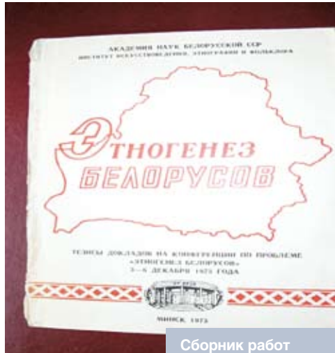
Сборник работ «Этногенез бело- русов». 1973 год