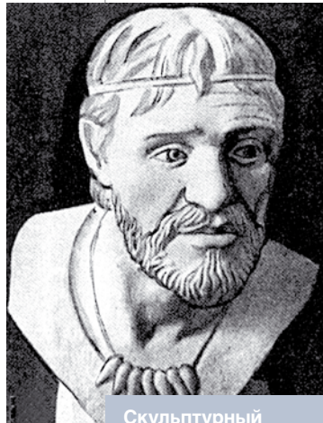
Скульптурный портрет, выполненный И.В. Чаквиным по черепу мужчины бронзового века из д. Красноселье Волковысского района

По данным археологии, вслед за отступлением ледника на территории Восточ-